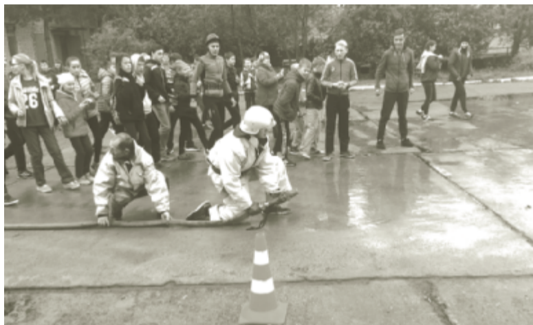
Участник комбинированной пожарной эстафеты.