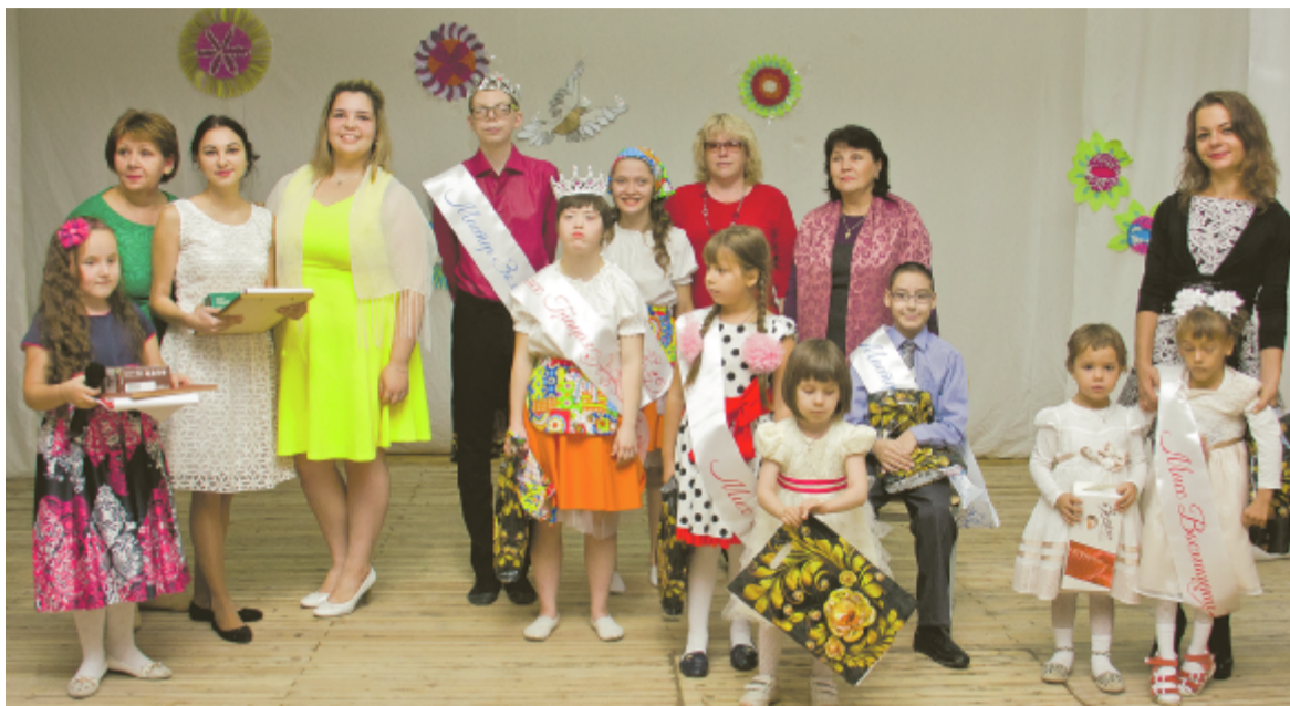
Участники конкурса после церемонии награждения.