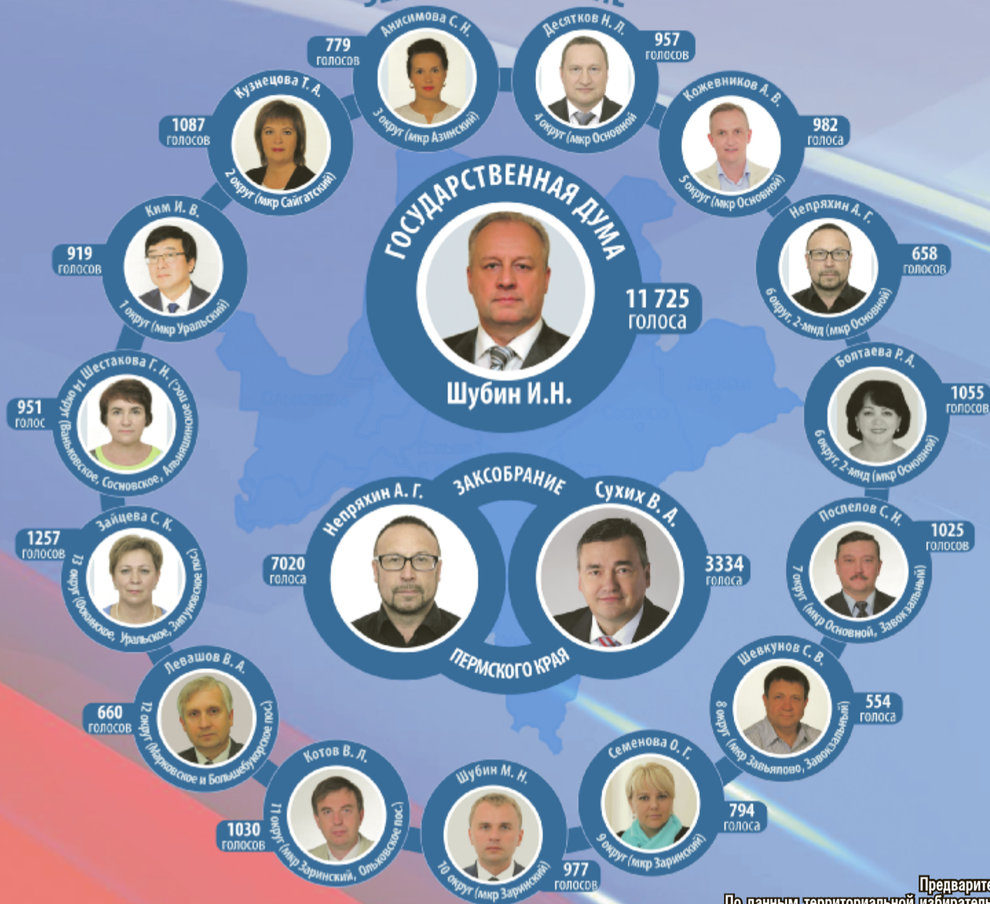
Предварительные результаты голосования 18 сентября 2016 г. По данным территориальной избирательной комиссии Чайковского муниципального района.