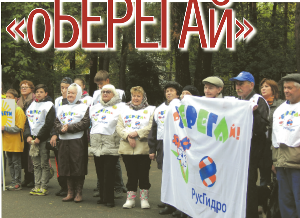
Митинг, посвященный непростой экологической ситуации.