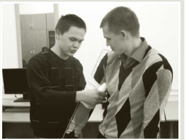
Один из этапов. Оказание первой помощи пострадавшему.

15 сентября 2016 года на автодроме автошколы ГБПОУ «Чайковский индустриальный колледж» состоялся муниципальный конкурс – соревнование юных водителей скутера и мопеда.