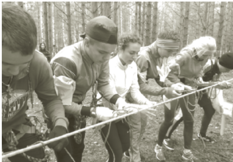
Состязание на полосе препятствий. Участники вяжут узлы.

Команды, занявшие I – III места в общекомандном зачете и по отдельным видам соревнований были награждены памятными дипломами и кубками.