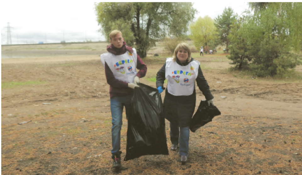
Участники акции наводят порядок на берегу реки Камы.