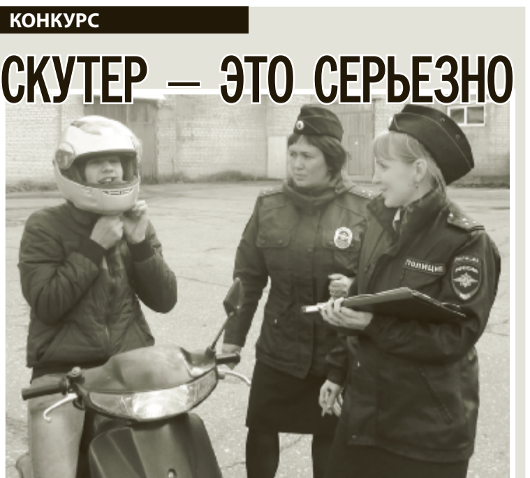
Подготовка к практическому этапу соревнований.