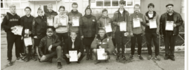
Участники состязаний. Фото на память.