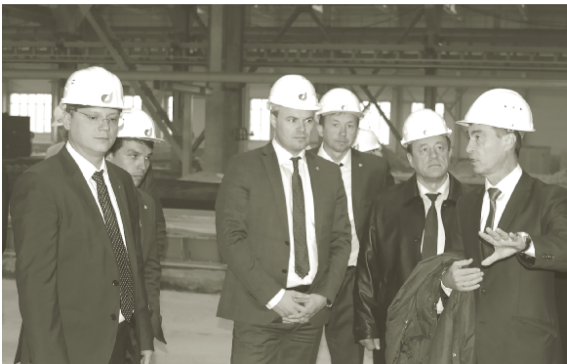
Гости на экскурсии по производственному цеху предприятия.

Запуск нового крупного промышленного производства будет способствовать улучшению экономического климата как