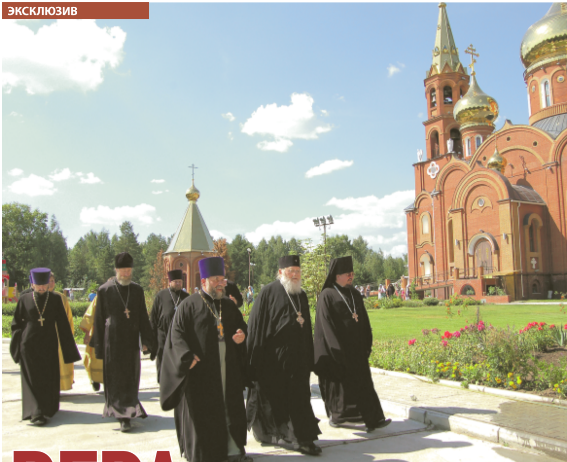
Встреча высокого зарубежного гостя священнослужителями Чайковского благочиния.