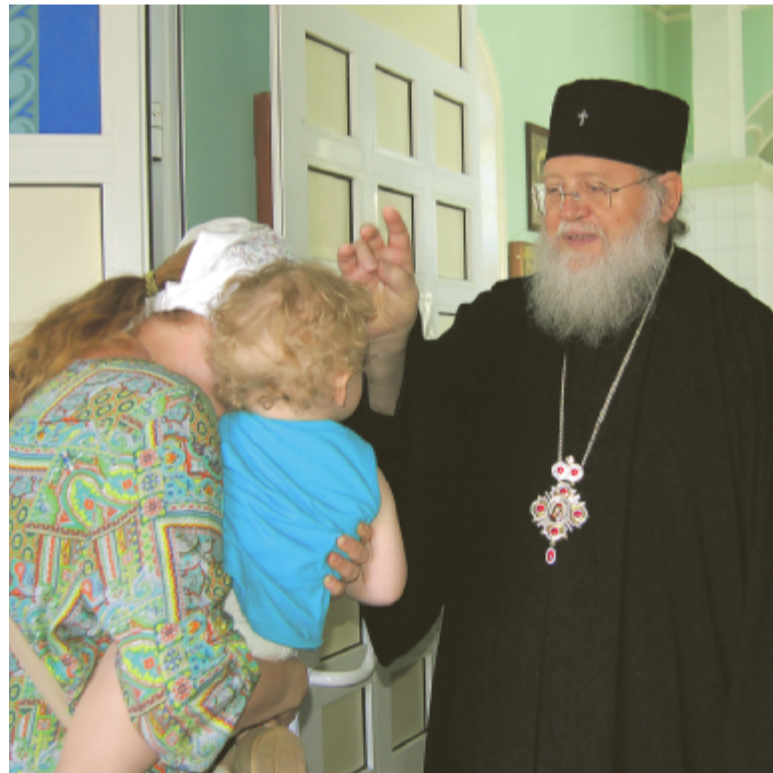
Благословение Митрополита Илариона.

Сколько было пройдено и прочувствованно нами за эти годы! В конце путешествий мы становимся единой семьёй и при расставании с грустью и слезами благодарим друг друга».