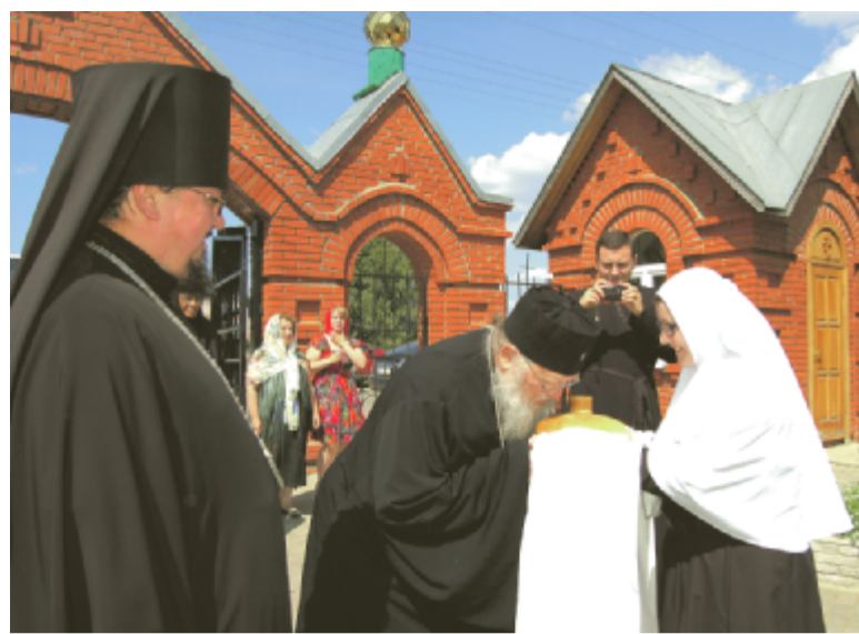
Июль 2016 г., с. Перевозное. Встреча иностранных паломников.