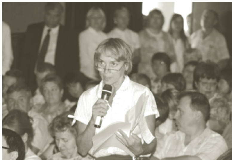
Тема ЖКХ стала одной из ключевых на встрече с главой региона.