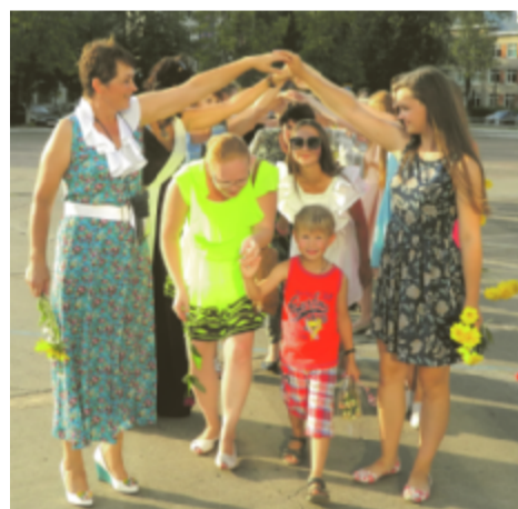
Народная игра «Ручеек», так любимая участницами.

И Организатором Международного флешмоба женственности в городе Чайковском является женский клуб «БОЖЕМА».