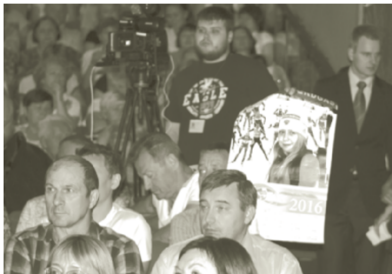
Желающих задать свой вопрос губернатору было довольно много.

Ж «За последние 4 года в консолидированном бюджете муниципального района каждый третий рубль — из краевого бюджета».