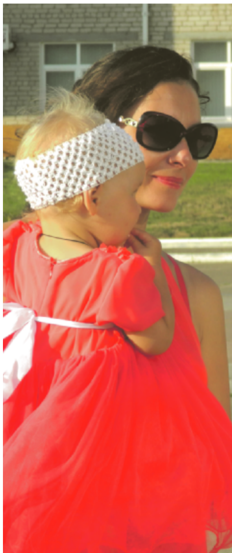
Некоторые женщины пришли вместе с очаровательными дочками.