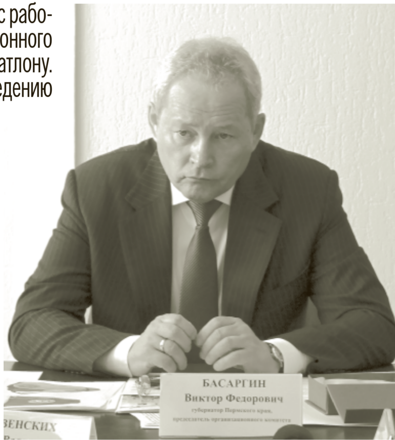
В. Басаргин – председатель оргкомитета, губернатор Пермского края.

И сполком Международного союза биатлонистов (IBU) постановил, что чемпионат мира по летнему биатлону в 2017 году пройдет в городе Чайковском. Для молодого биатлонного центра в Пермском крае это будет первый международный старт, а для России уже пятый летний чемпионат мира. В 2000 году эти соревнования принял Ханты-Мансийск, в 2006 и 2012 Уфа, а в 2014 Тюмень. В последние годы центр зимних видов спорта «Снежинка» в Чайковском был неизменным местом проведения летних чемпионатов России.