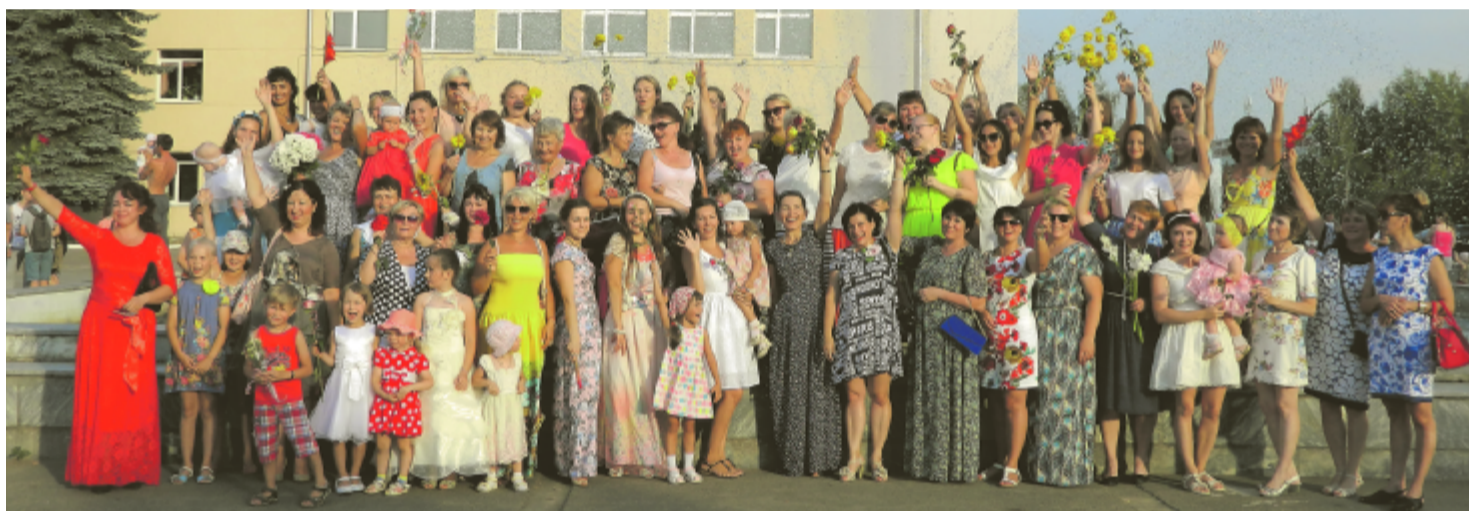
Участницы Международного флешмоба женственности.

Около шестидесяти представительниц прекрасного пола Чайковского приняли участие в традиционном Международном флешмобе женственности.