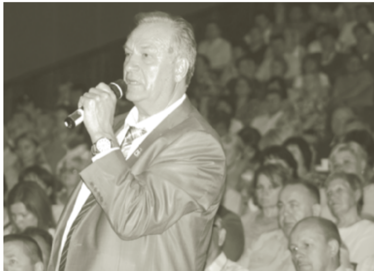
Директор «Птицефабрики «Чайковская» посетовал на то, что предприятие не вовремя получает бюджетные средства.