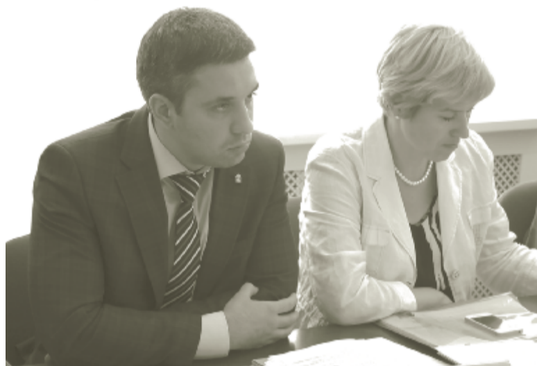
Министры краевого правительства Н.Н. Гончаров (имущество и земельные отношения), О.В. Антипина (финансы).

До чемпионата мира по летнему биатлону в Чайковском остается чуть больше года. За это время всем уровням власти предстоит осуществить огромный объем подготовительной работы, чтобы с достоинством встретить многочисленных гостей и провести знаковое для территории мероприятие на высшем уровне. Этапы подготовки к международным соревнованиям были обсуждены участниками оргкомитета.