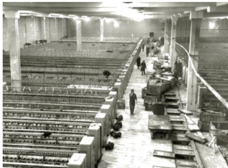
Монтаж прядильного оборудования.

Наверное, главная особенность коллектива комбината того времени заключалась в его молодости. Средний возраст рабочих составил всего 23 года. Большинство руководителей всех уровней моложе 40 лет. Несмотря на недостаточность знаний и умений у них было