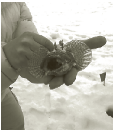
Редкая добыча рыбака.

И Настоящий рыбак из любой лужи в любое время выловит рыбу и накормит всех.