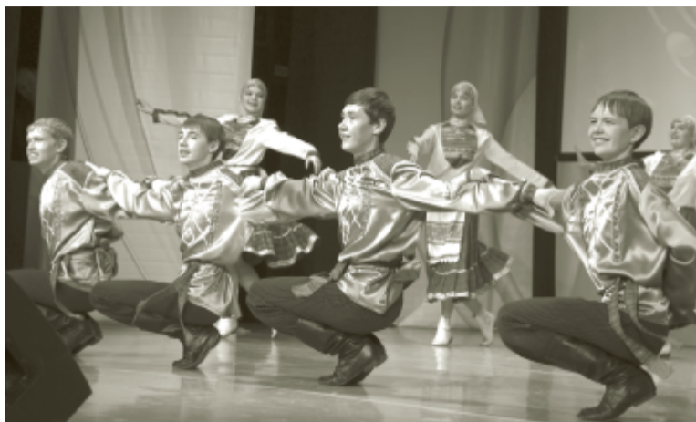
Фото автора. Обладатель диплома 1-й степени в номинации «Народная хореография» (юношеская категория) – Народный ансамбль танца «Малахит» (КСЦ) с танцевальной композицией «Удмуртская молодёжная пляска».

Под занавес марта в Культурно-спортивном центре ООО «Газпром трансгаз Чайковский» прошёл VI корпоративный фестиваль-конкурс «Факел надежды – 2016», в котором приняли участие юные таланты в возрасте от 5 до 16 лет из Пермского края и Удмуртской Республики.