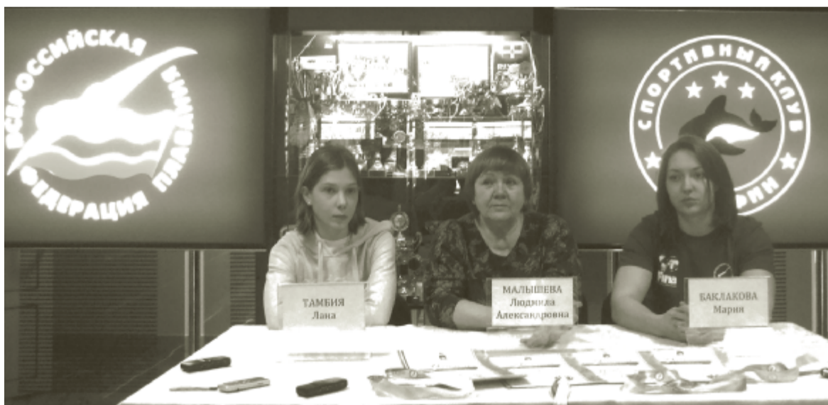
Чайковские пловчихи с тренером.

1 курса Чайковского государственного института физической культуры.