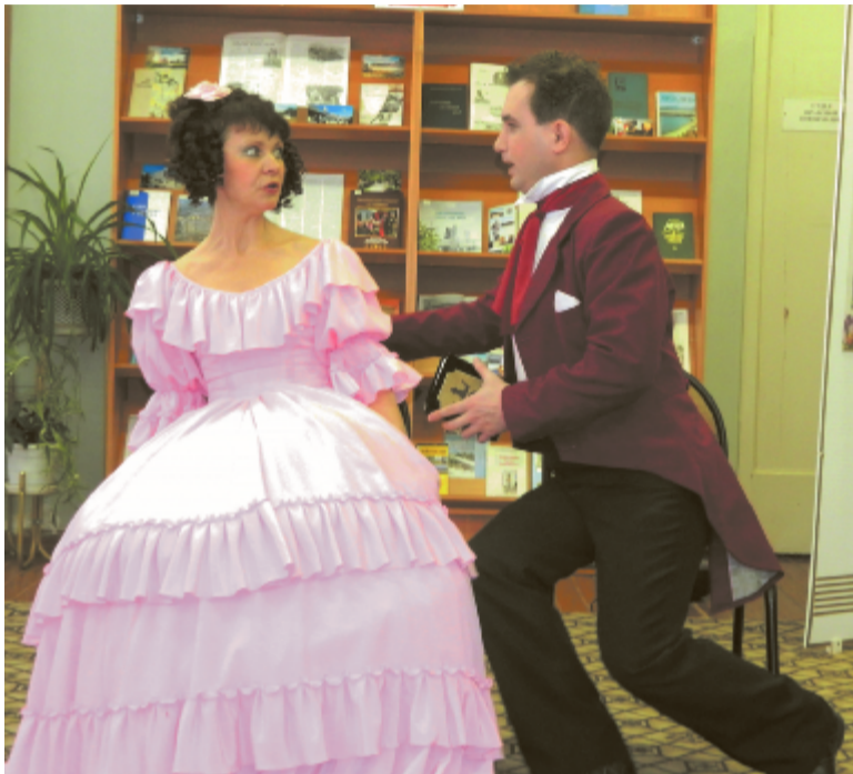
Сцена из комедии Н.В. Гоголя «Ревизор».