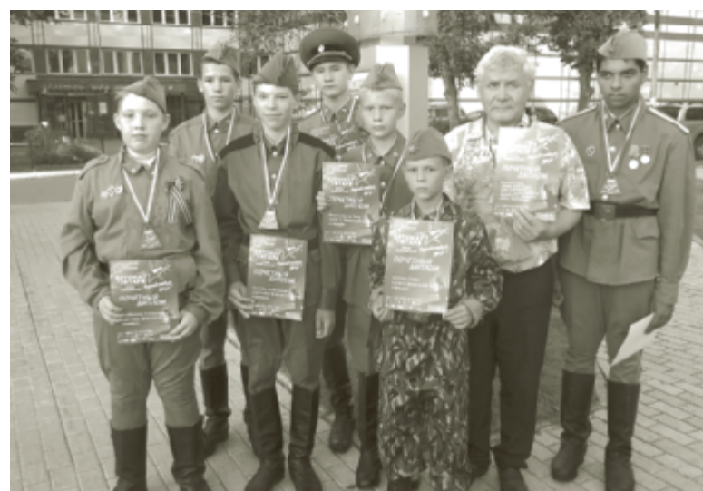
Учащиеся Марковской средней школы успешно дебютировали на фестивале.