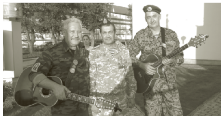
Гости – исполнители из Перми, группа «Затвор».