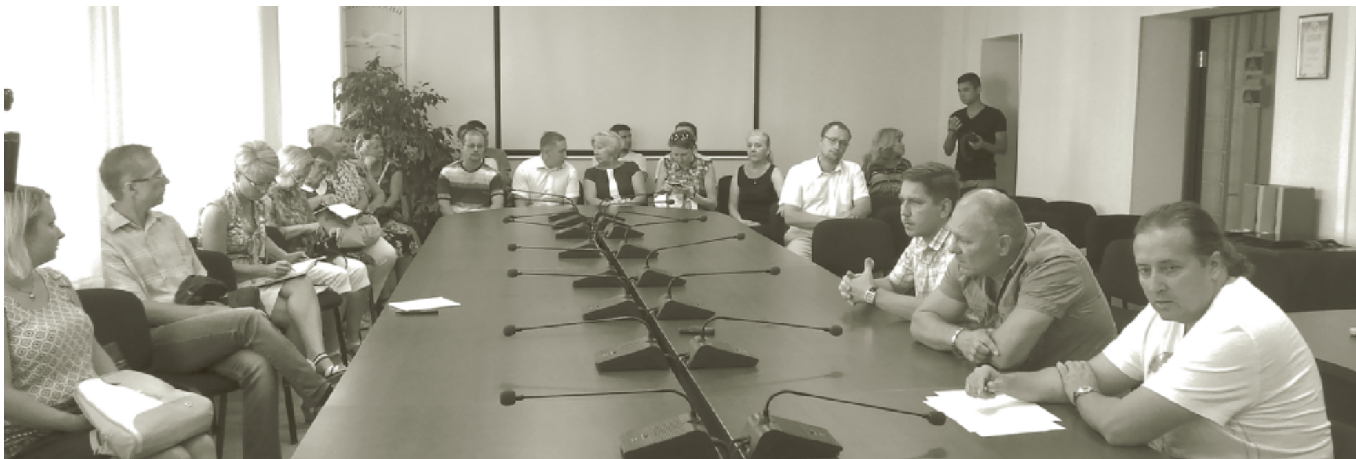
На встрече 19 августа руководители РСУ-6 ответили на вопросы дольщиков и главы города.

В чайковской администрации 19 августа прошла встреча, которую очень ждали. Особенно ждали ее участники долевого строительства пяти печально известных в городе новостроек по Сиреневому бульвару, Камской и Декабристов. Сроки сдачи этих объектов неоднократно переносились, люди обеспокоены ситуацией и обращаются за помощью во все инстанции.