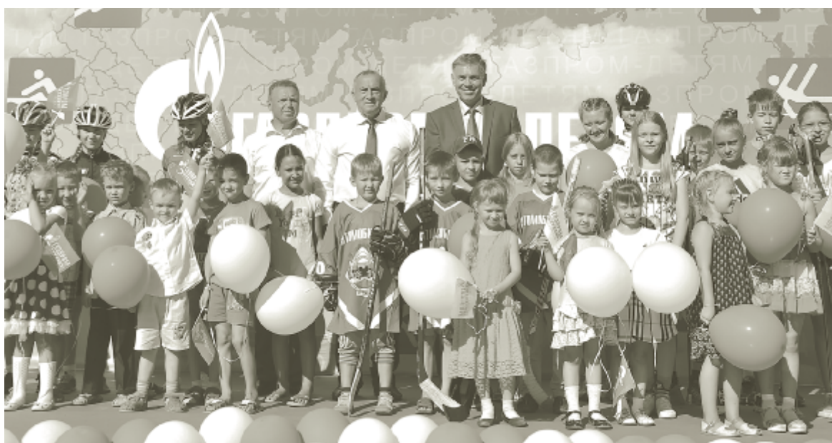
Будущие хозяева спорткомплекса с почетными гостями церемонии.

«Этот спортивный объект мы планируем завершить к декабрю 2018 года, – сообщил генеральный директор ООО