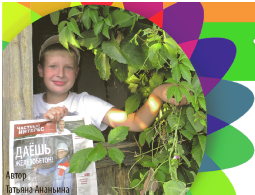
Автор Татьяна Ананьина