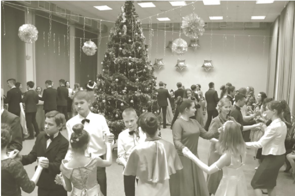
Яркой и красочной частью новогоднего бала стало исполнение классических танцев гостями торжества.

«Мне очень приятно, что сегодня здесь собрались таланты нашего района. Ребята в таком юном возрасте, но уже знают, чего хотят и целенаправленно идут своей дорогой. Именно