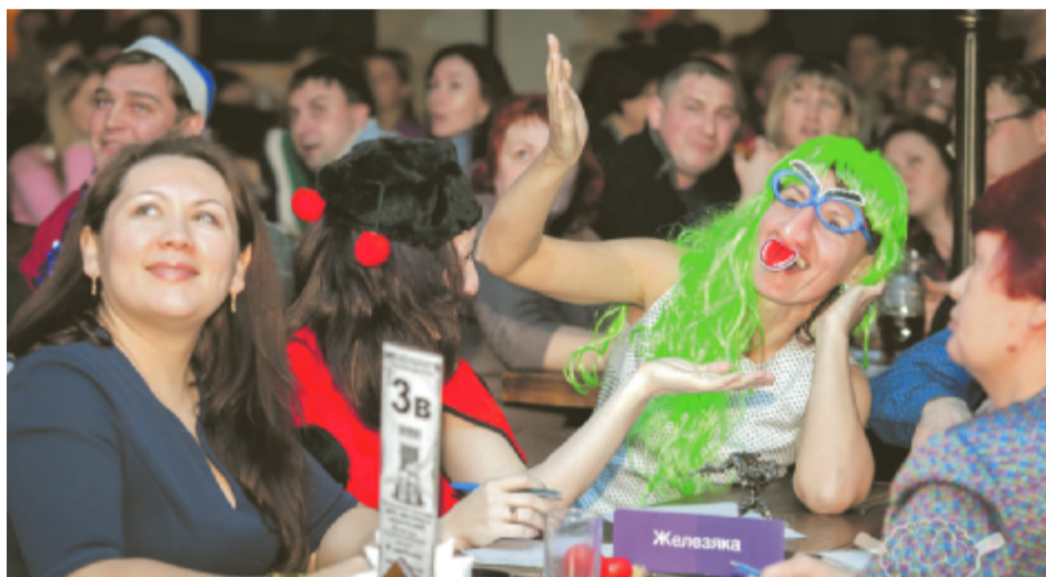
Яркие моменты предновогодней игры.

В Чайковском 22 декабря прошла очередная «Мозгобойня», уже четырнадцатая по счету. Развлекательный комплекс «Серебряный шар» был переполнен чайковскими интеллектуалами, желающими получить море эмоций и позитива. Разгорелась жаркая битва.