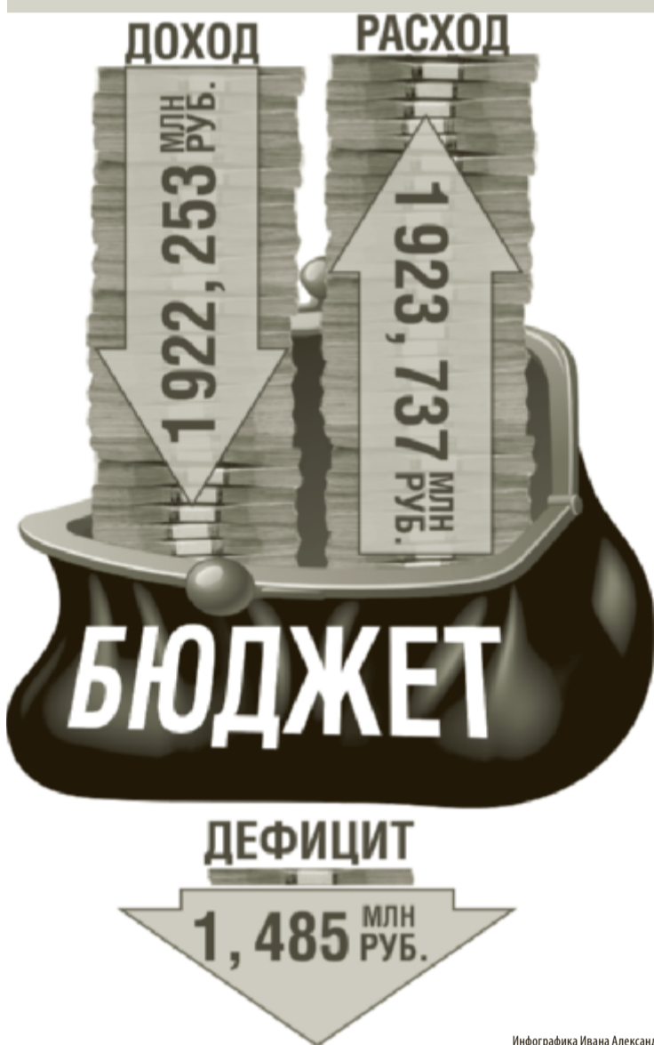
Инфографика Ивана Александрова.

На последнем в этом году декабрьском заседании депутаты Земского Собрания приняли бюджет Чайковского муниципального района на 2017 год и плановый период 2018-2019 годов во втором чтении.