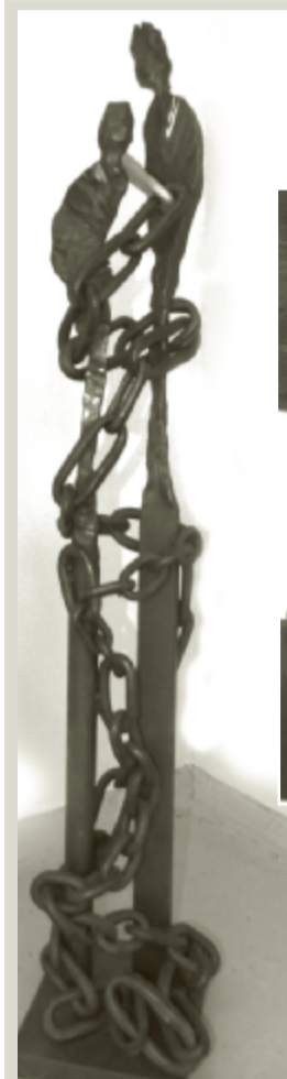
Звено (2014 год), металл.