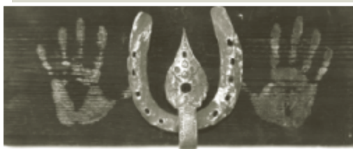
Раскрашивание конька (2009 год), дерево, металл.

7 апреля в Чайковской художественной галерее в рамках «Дней словацкой культуры» состоялось открытие выставки словацкого скульптора Станислава Миковчака «Кованые сны».