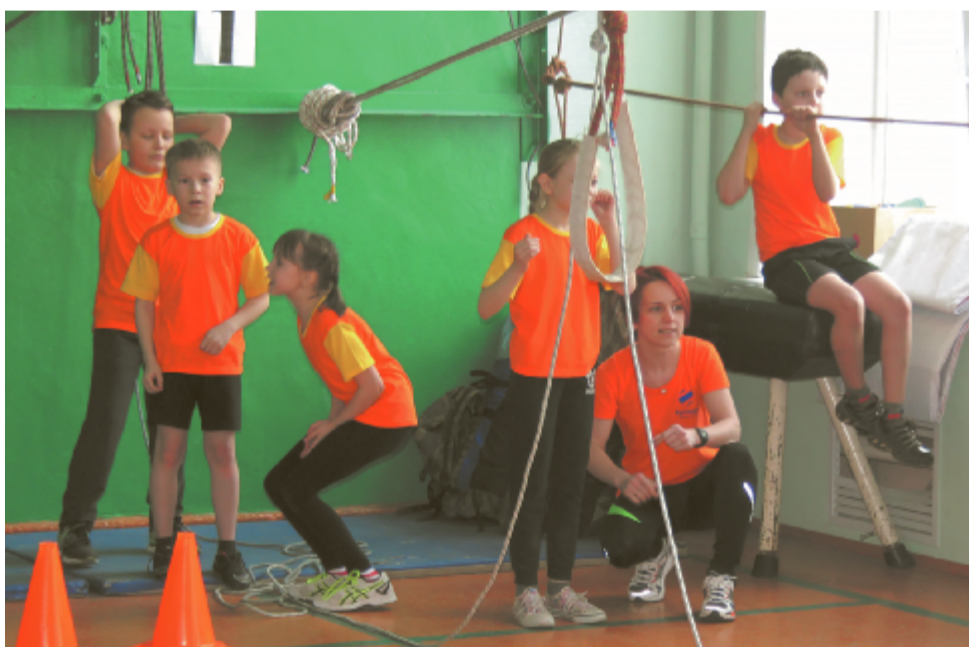
Команда «Спортивная братва» СОШ №10.

третьих классов «Гимназии») и «Улыбка» (6 «Б» класс, СОШ №11).