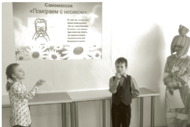
Воспитанники подготовительной группы детского сада № 24.