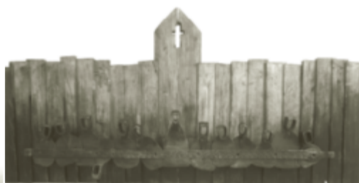
Тайная вечеря (2013 год), дерево, металл.