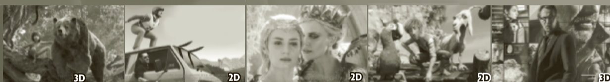
Книга джунглей 3D

Уточняйте расписание в КЦ «Кама» по телефону 3-23-08