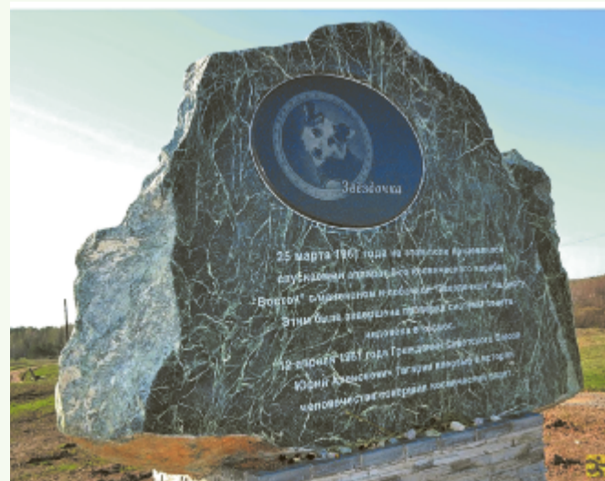
Памятник собаке Звездочке, установленный на месте падения спускаемого аппарата в с. Карша.

Наибольшее время на борту космического корабля провел советский и российский космонавт Сергей Крикалев – 803 дня 9 часов 38 минут и 32 секунды . Всего совершил 6 полетов и 8 выходов в открытый космос. Общая продолжительность работ в открытом космосе – 41 час 26 минут .