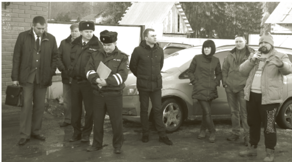
Сотрудники надзорных ведомств безмолвствуют.

Участники собрания озвучили своё недовольство и по поводу качества уборки снега с улиц своего