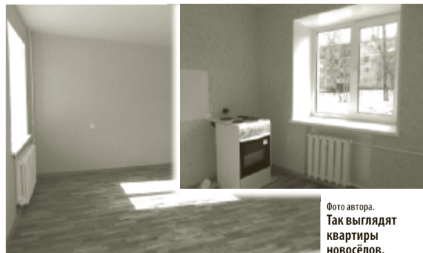
Так выглядят квартиры новоселов.