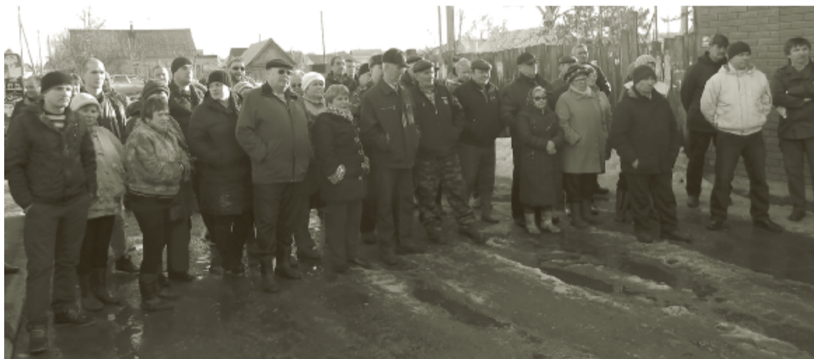
Жители Зари-2 требуют отремонтировать дорогу.