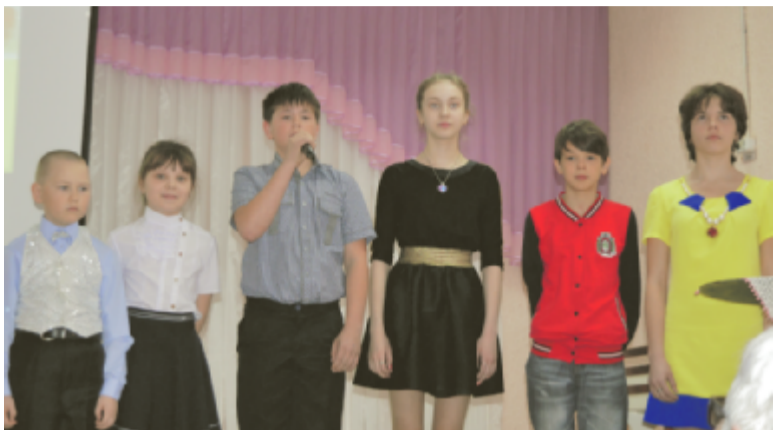
Участники фестиваля.