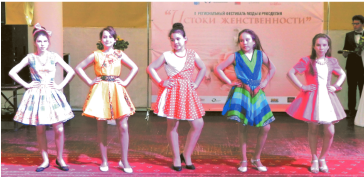
Участницы модного дефиле.

лать девизом показа. Ведь вещи без женщин-моделей — это просто вещи. В роли моделей по модному подиуму прошлись женщины разных возрастов — от самых юных модниц до прекрасных дам. И все они были очаровательны, женственны и современны. И каждая была готова своей красотой хотя бы чуть-чуть изменить мир в лучшую сторону.