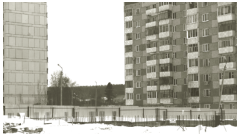
Застывшая стройка.