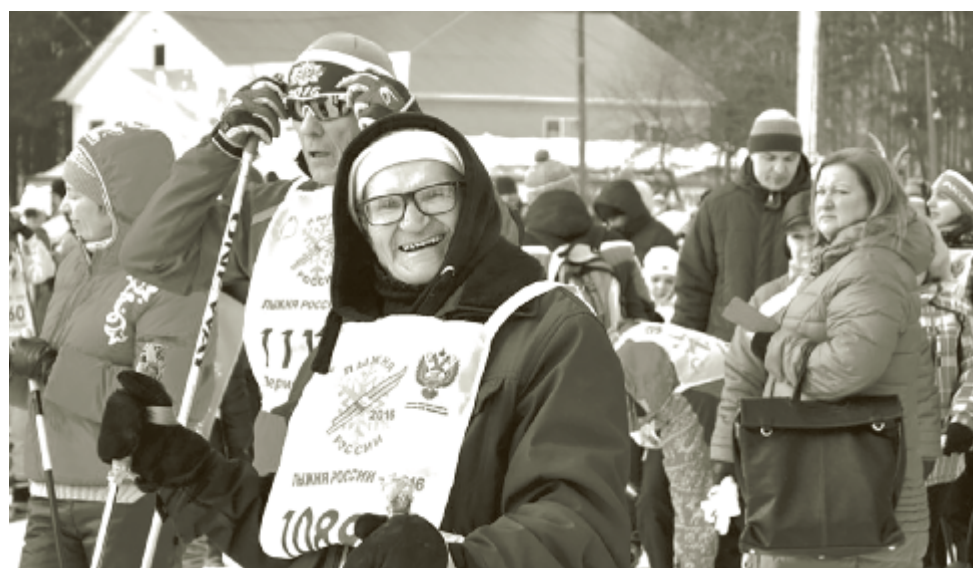
Возраст спорту не помеха.