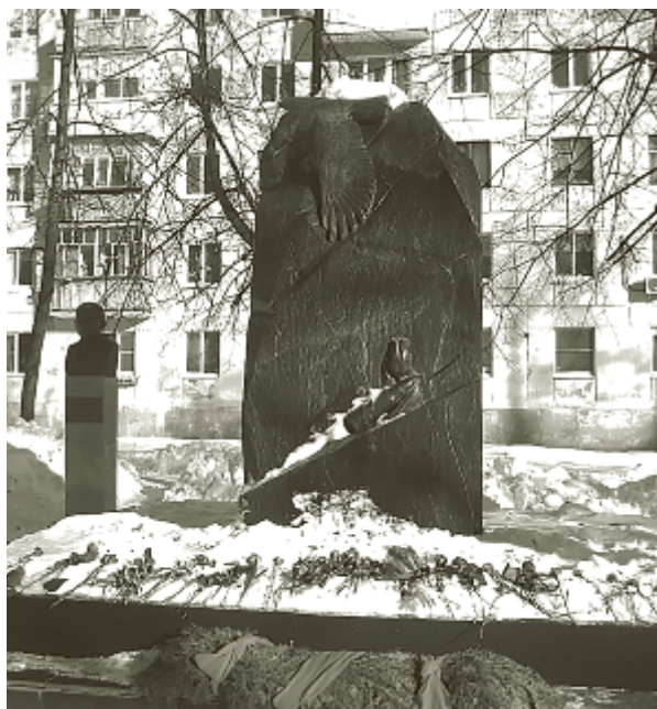
Монумент воинам.

Пятнадцатого февраля в нашей стране отмечается День памяти российских воинов, исполнивших служебный долг за пределами Отечества. Именно в этот день в 1989 году последняя колонна советских войск покинула территорию Афганистана. Закончилась афганская война, через горнило которой прошло более полумиллиона военнослужащих. Более 15 тысяч ребят не вернулись с этой войны, 53 тысячи пришли домой с ранениями, контузиями, травмами, 417 человек пропали без вести или попали в плен.