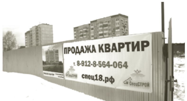
Потенциальный долгострой.