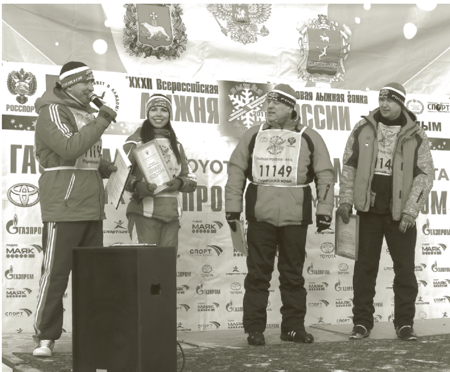
Церемония открытия «Лыжни России-2016».

Самые большие рекорды массовой лыжной гонки — это улыбающиеся, жизнерадостные лица участников соревнований, пересекающие финишную черту, а самая высокая награда — вера людей в свои безграничные возможности на пути к спортивным вершинам!