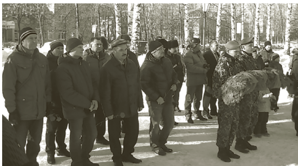
Дань памяти воинам-интернационалистам.