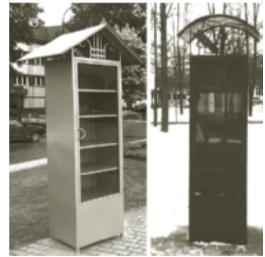
Уличные библиотеки.

P.s. Поделитесь новостью с вашими родными и близкими! БлагоДарим!