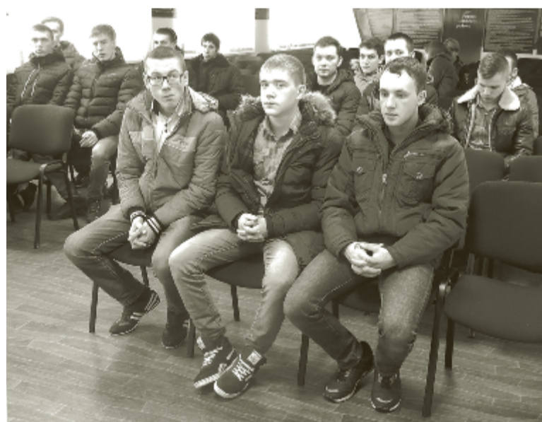
Будущие защитники правопорядка.

В завершение экскурсии полицейские ответили на все вопросы ребят, в частности, о том, как