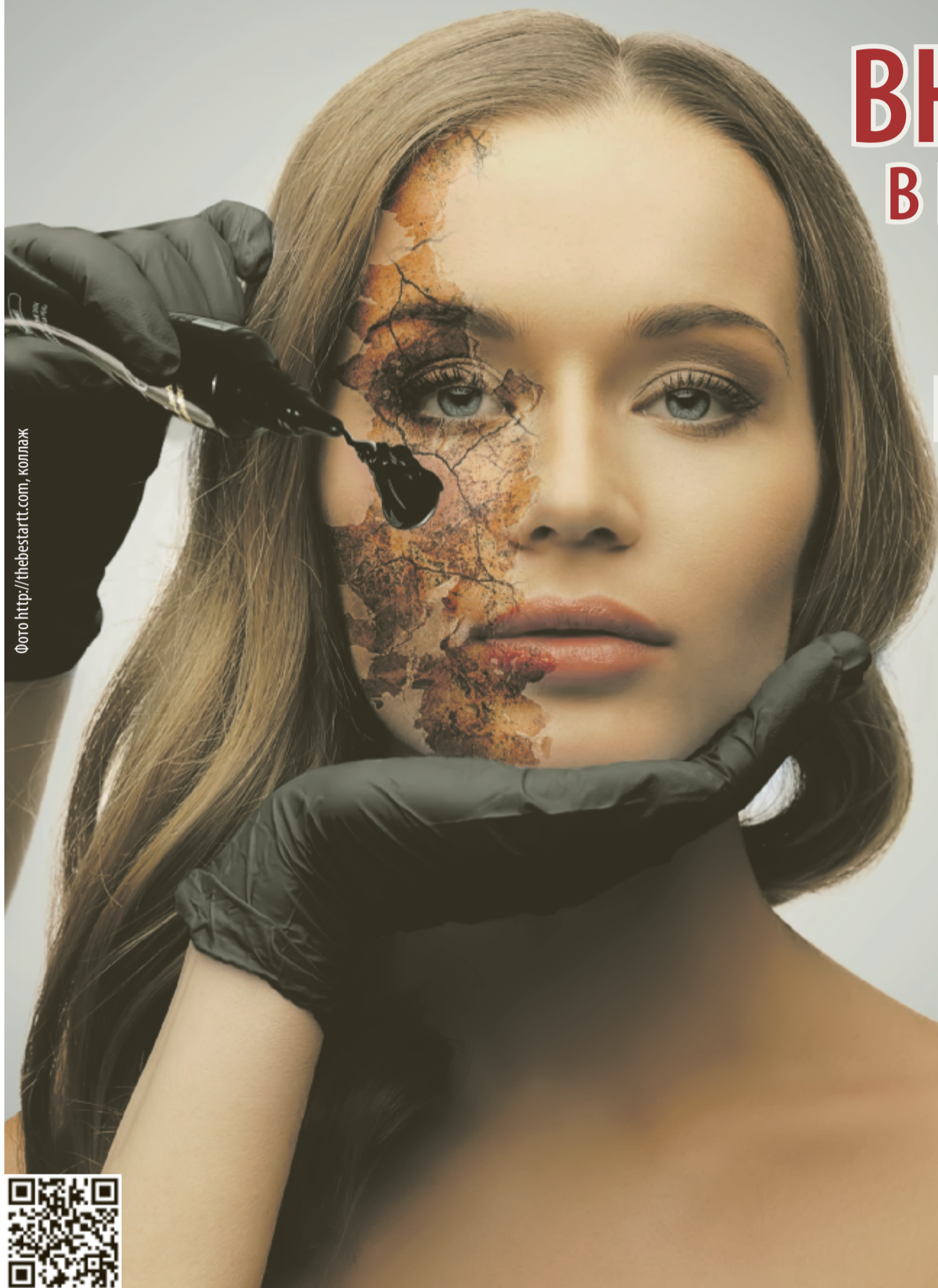
Фото http://thebestart.com , коллаж

В.В. Путин: «Все должны понять, что жить, соблюдая закон, гораздо комфортнее и выгоднее, чем пытаться его обойти».