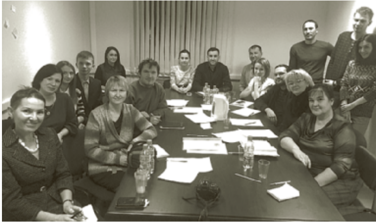
Лидеры общественных организаций.

На сегодняшний день на площадке «Живого города» активно проходят рабочие встречи представителей общественных организаций с участием бизнеса и власти, на которых презентуются социальные проекты.