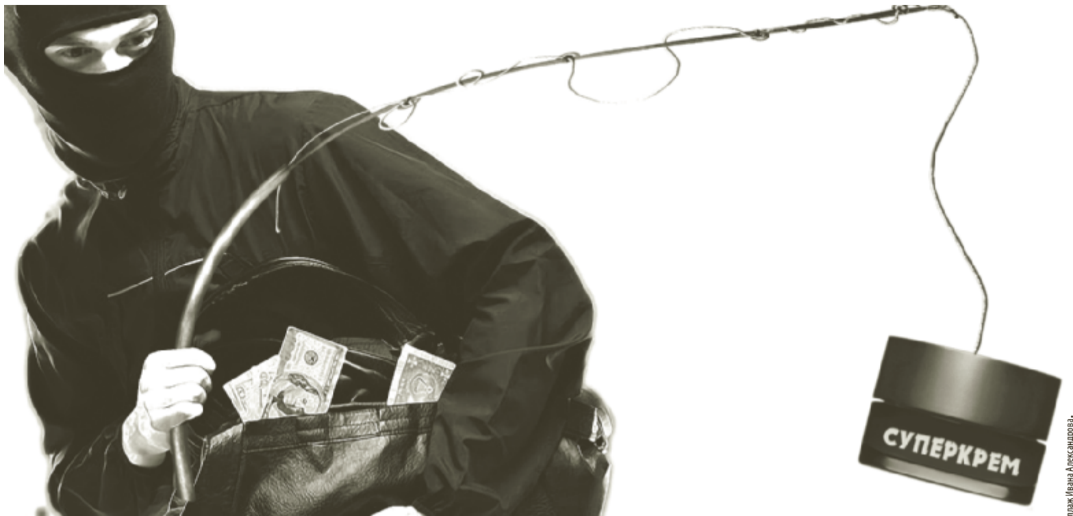
Коллаж: Ивана Александрова.

Вопреки моим ожиданиям до самой процедуры пришлось достаточно долго общаться с этой милой девушкой, которая расспрашивала меня о том, как я ухаживаю за собой, о возрасте, об условиях работы, о доходах, сколько бы я хотела тратить на косметику, какую сумму каждый месяц я вкладываю в себя. Постепенно доброжелательный тон девушки сменился на настойчивый призыв обратить внимание на мои возрастные проблемы, было ЧЕСТНО указано, на какой возраст я сейчас выгляжу. Затем девушка отвела меня в кабинет компьютерной диагностики кожи лица, где я в уже достаточно подавленном состоянии выслушала еще более суровую ПРАВДУ о себе. После всей этой информации косметолог вновь доброжелательным тоном рассказала мне об израильской чудо-косметике, постойно заставляя меня отвечать на ее вопросы, и принялась