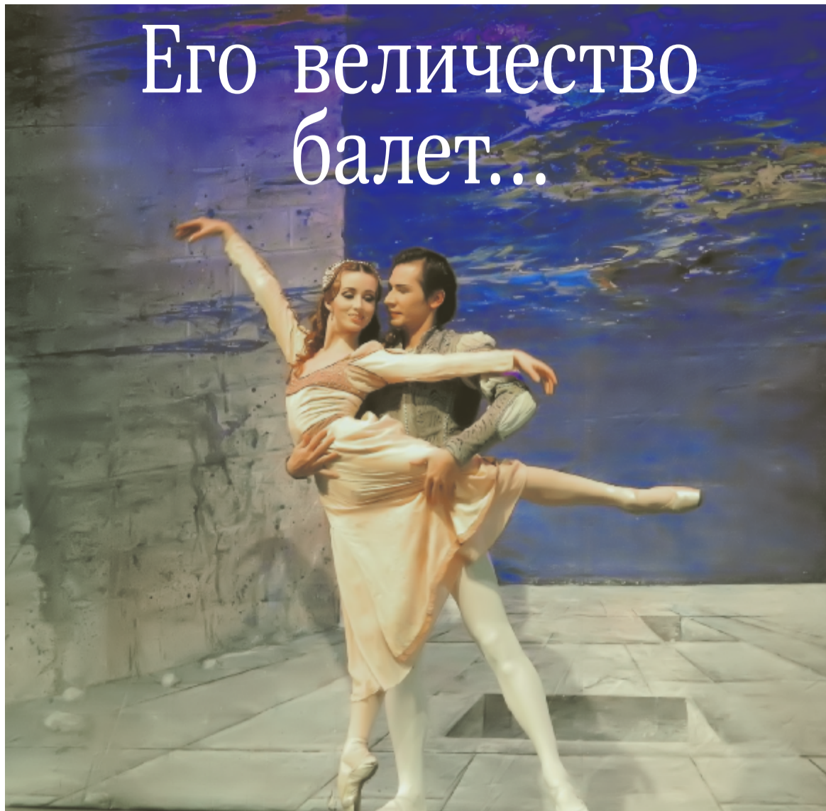
Ромео и Джульетта.

Внимание зрителя полностью захватывает увлекательная смена уличных плясок и трепетных любовных сцен, выраженных с такими подлинными эмоциями на лицах и в пластике артистов балета, что по телу то и дело