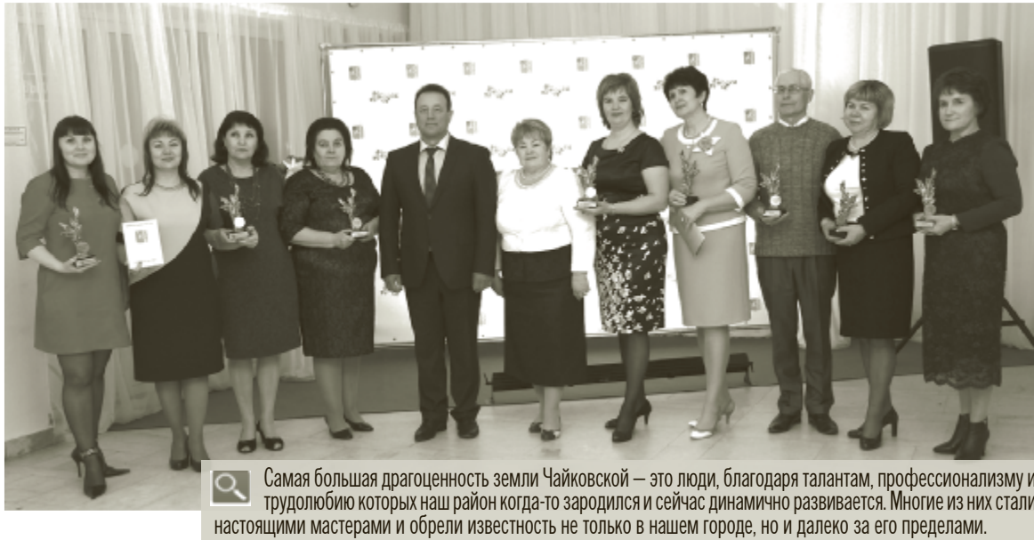
Самая большая драгоценность земли Чайковской — это люди, благодаря талантам, профессионализму и трудолюбию которых наш район когда-то зародился и сейчас динамично развивается. Многие из них стали настоящими мастерами и обрели известность не только в нашем городе, но и далеко за его пределами.

В этом году конкурс был проведен по 8 номинациям, на которые заявилось 28 номинантов — людей, своим ежедневным созидательным трудом вносящих вклад в развитие и процветание Чайковской территории, создающих комфортные условия для проживания земляков. Они настоящие мастера своего дела, и, несомненно, все достойные люди. Однако победителей все-таки пришлось выбирать.