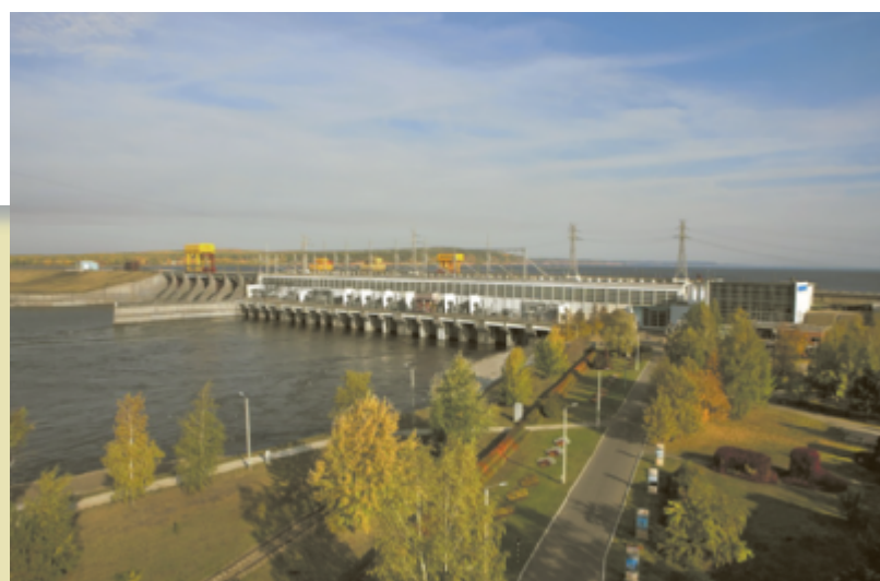
2015 год.