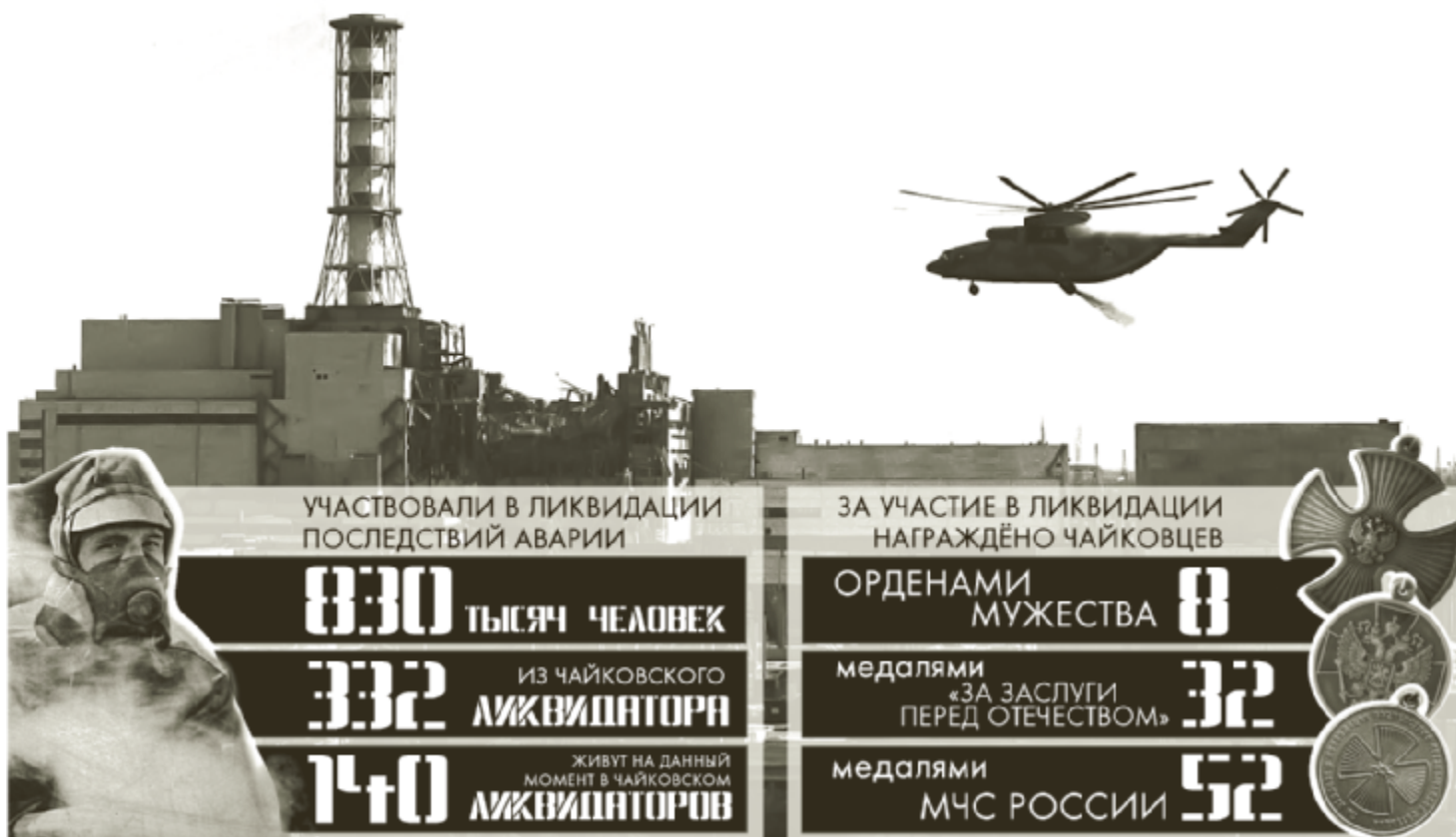
Инфографика Ивана Александрова