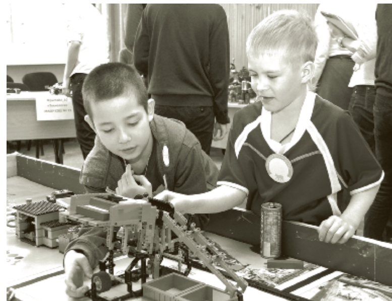
Юные Самоделкины.

Сами ребята с восхищением в глазах рассказывают, как увлекательно проходят занятия, на которых они открывают для себя что-то новое; рассказывают, как каждый раз в команде вместе с учителем стремятся воплотить в жизнь свою мечту: сконструировать и спроектировать такого робота, который поможет людям сделать мир лучше, например, возьмет пробы грунта на Марсе, обезвредит взрывное устройство,