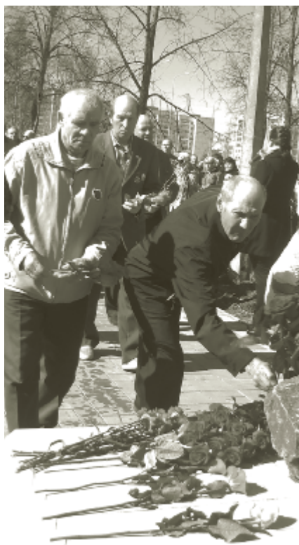
Церемония возложения цветов к памятнику.

«Мы победили Чернобыль тридцать лет назад, но он убивает нас все эти тридцать лет», — так говорят ликвидаторы — люди, чьи жизни и здоровье забрал взорвавшийся энергоблок Чернобыльской АЭС.