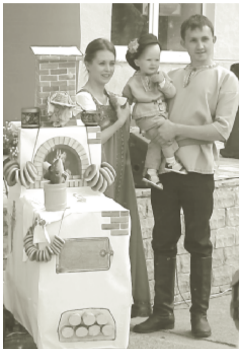
Семья-участник парада колясок.