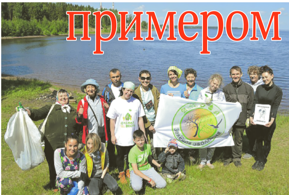
Фотография на память. Участники экологического субботника.

Мероприятие поддержали бизнесмены и депутаты, актив микрорайона «Заринский».