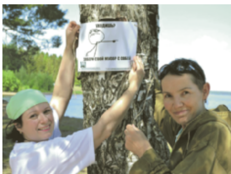
Эооактивисты повесили на деревьях плакаты-мемы с призывом не мусорить в лесу.