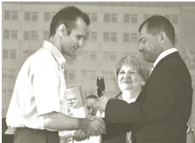
Награждение победителей конкурса профмастерства «Лучший по профессии».

Торжественное мероприятие, посвящённое празднованию Дня работников текстильной и легкой промышленности, состоялось 11 июня во Дворце молодежи.