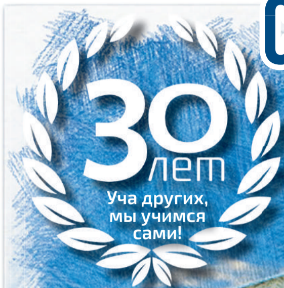
Фото С. Мартышевой, коллаж Ю. Пальзабой