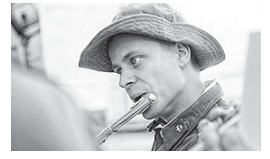
17.55, 19.00, 20.00, 20.55 Т/с «ПРОВЕРКА НА ПРОЧНОСТЬ» [16+]