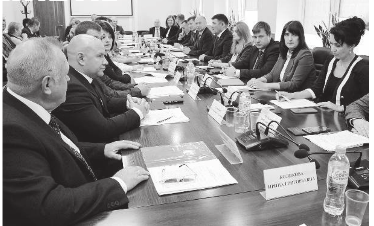
Утверждение Положения о порядке проведения конкурса по отбору кандидатов на должность главы округа стало одним из главных вопросов пленарного заседания.

Комиссия по социальной и экономической политике объединила в себе два направления деятельности: рассматривает вопросы образования, оказания медпомощи, созда-