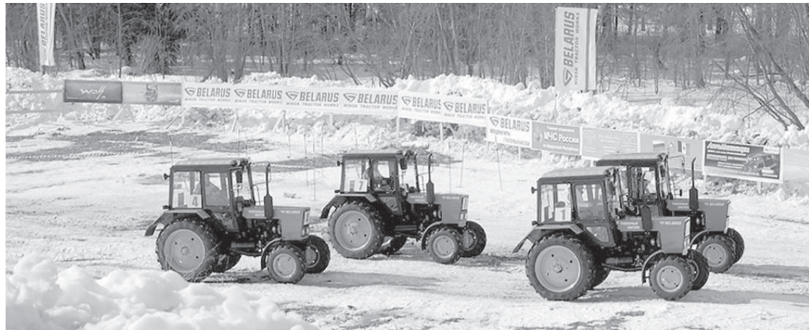
В женском заезде участвовала министр сельского хозяйства Удмуртии Ольга Абрамова на тракторе под № 1