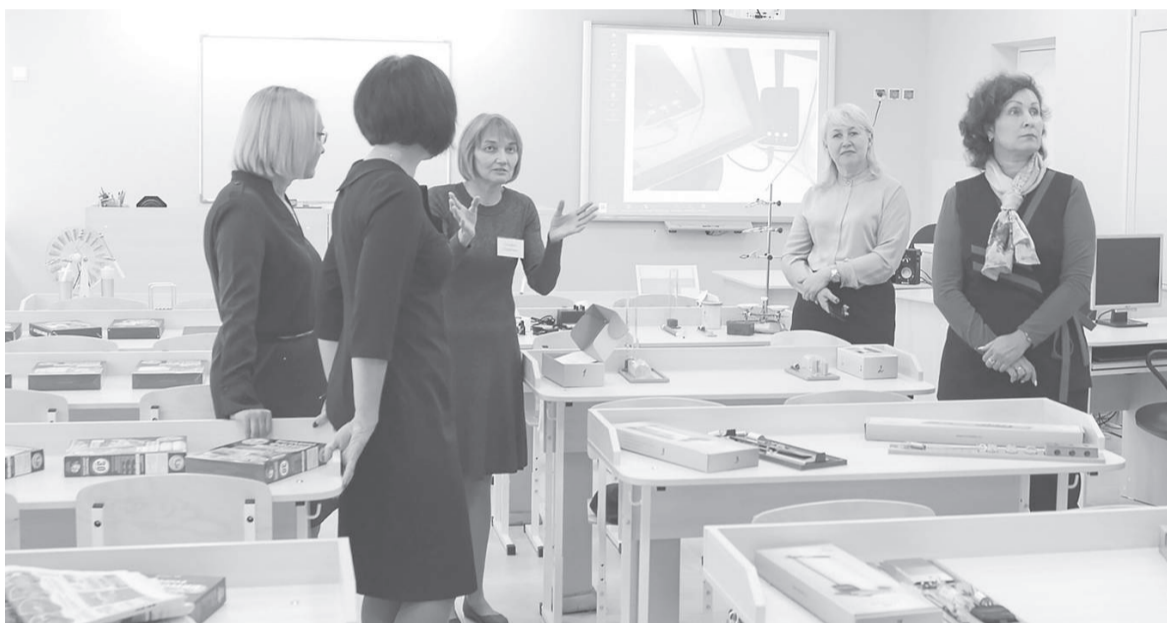
Школа в селе Уральском превосходит по оснащению классов точных наук все остальные школы городского округа. С начала учебного года её присоединят к седьмой школе. Кроме того, Управление образования планирует развить её потенциал вплоть до создания на этой базе эксклюзивного образовательного учреждения

Во-первых, сегодня директора сельских школ, решая ежедневные текущие материально-технические, юридические, а также вопросы жизнеобеспечения школ, вынуждены постоянно находиться в городе. Поэтому часто образовательное учреждение остаётся без внимания руководителя. Да и трудно найти в деревне человека, способного са-