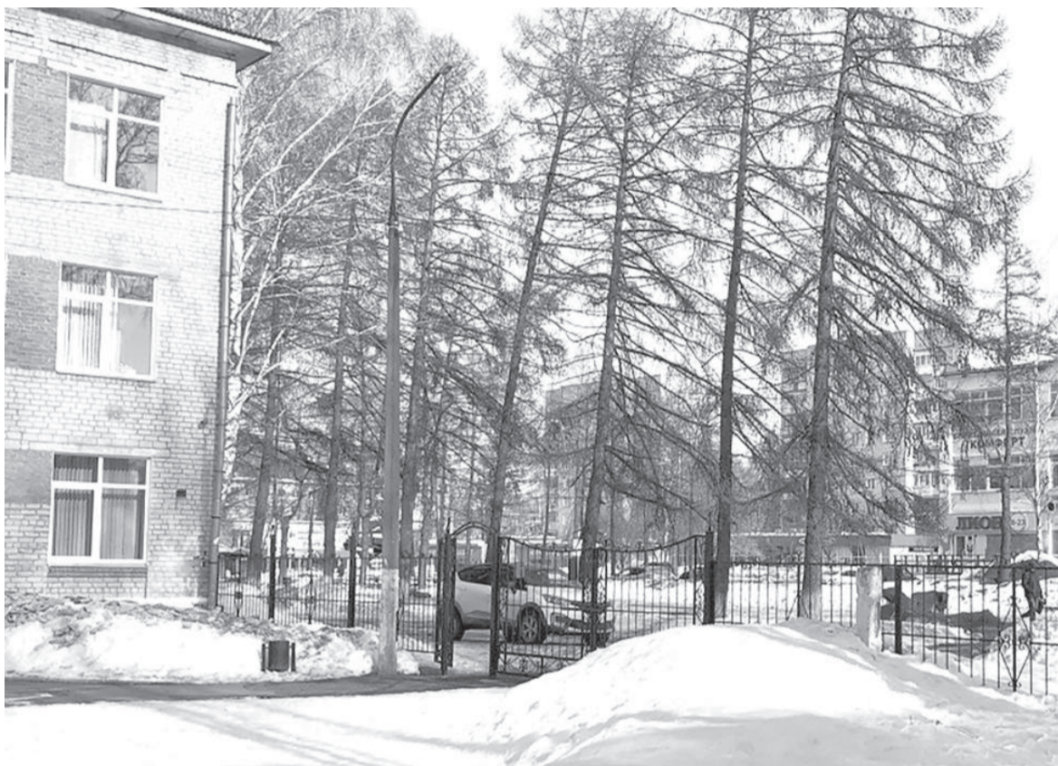
Жителей нашего города волнует близкое соседство школы № 4 с алкогольным магазином, но оно соответствует принятым на нашей территории нормам

ЧТО ДЕЛАТЬ, ЕСЛИ ВЫ ОБНАРУЖИЛИ ПРОДАЖУ АЛКОГОЛЯ ВБЛИЗИ ШКОЛЫ? КАКИЕ ТРЕБОВАНИЯ СУЩЕСТВУЮТ К ПРОДАЖЕ АЛКОГОЛЯ РЯДОМ С УЧЕБНЫМИ ЗАВЕДЕНИЯМИ? ОТВЕТЫ НА ЭТИ ВОПРОСЫ В НОВОЙ РУБРИКЕ «ВОПРОС ПРОКУРОРУ».