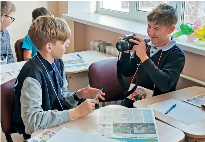
На площадке «Журналист» ребята попробовали сделать фотографии профессиональным фотоаппаратом и даже взять друг у друга интервью

Евгения Смелова