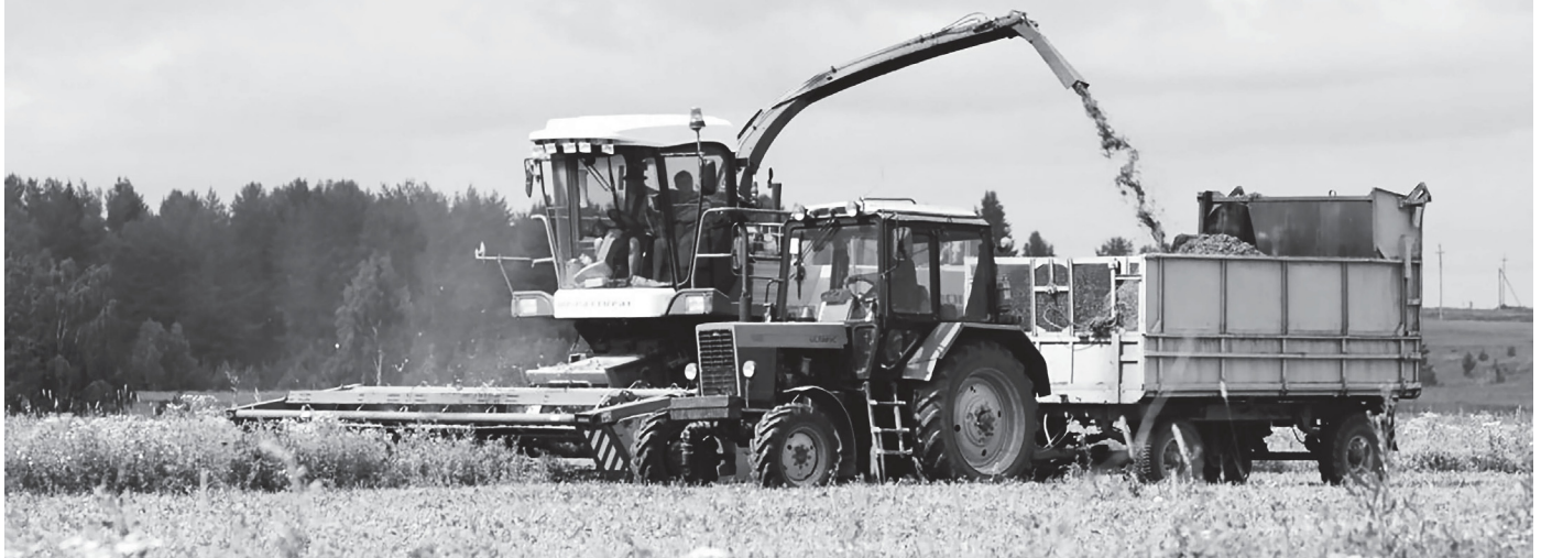
Сбор люцерны птицефабрикой «Чайковская» для производства витаминно-травяной муки, которая в дальнейшем используется на предприятии для корма скота и птиц

НЕБЛАГОПРИЯТНЫЕ ПОГОДНЫЕ УСЛОВИЯ В ЭТО ЛЕТО ДОСТАВИЛИ МАССУ ХЛОПОТ МЕСТНЫМ СЕЛЬСКОХОЗЯЙСТВЕННИКАМ. ОДНАКО ОБЪЕМЫ УРОЖАЯ В ЧАЙКОВСКОМ, НЕСМОТРИ НА ЭТО, ВСЁ ЖЕ ОКАЗАЛИСЬ ВПОЛНЕ ПРИЛИЧНЫМИ.