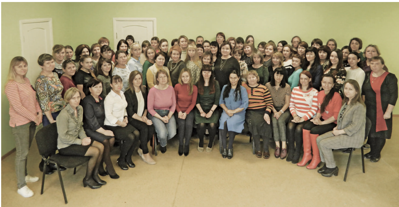
Большая часть дружного коллектива бухгалтеров

В НОЯБРЕ МНОГО ПРОФЕССИОНАЛЬНЫХ ПРАЗДНИКОВ, И ОДИН ИЗ НИХ ОТМЕЧАЮТ РАБОТНИКИ МНОГОГРАННОГО МИРА ЦИФР, СЧЕТОВ, ОТЧЁТОВ, СМЕТ... В ПРЕДДВЕРИИ ДНЯ БУХГАЛТЕРА, КОТОРЫЙ ОТМЕЧАЕТСЯ 21 НОЯБРЯ, МЫ УЗНАЛИ, КАК УСТРОЕНА РАБОТА НЕДАВНО СОЗДАННОГО МУНИЦИПАЛЬНОГО КАЗЁННОГО УЧРЕЖДЕНИЯ «ЦЕНТР БУХГАЛТЕРСКОГО УЧЁТА».