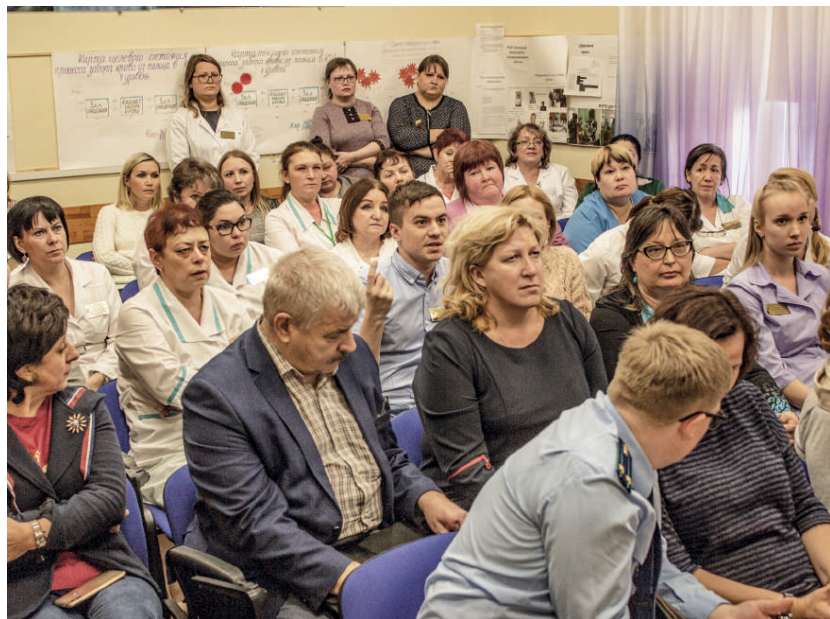
Сотрудники детской городской больницы задали министру здравоохранения Пермского края все волнующие их вопросы

Светлана Мартюшева, Маргарита Неклюдова