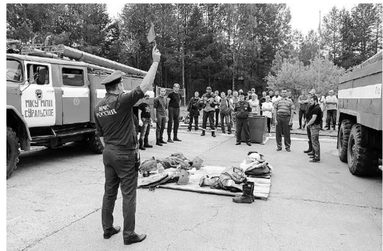
Материалы полосы подготовила Лидия Ломакина.

Призовые места распределились следующим образом: третье место заняла команда п. Марковского; вторыми стали добровольцы Уральского сельского поселения, а победа в руках команды Альяншинского сельского поселения.