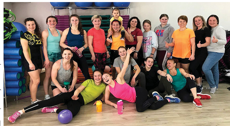
Плотный тренировочный график распisan у гребцов на целый год.