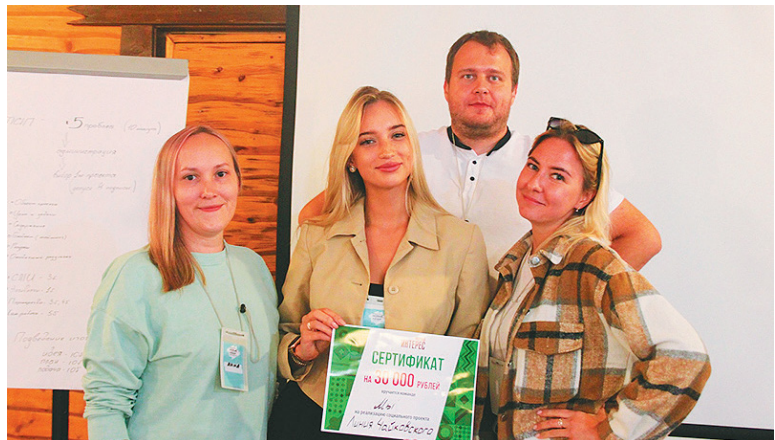
Команда-победительница «Мы», разработавшая туристический проект «Линия Чайковского», получила от «Частного Интереса» сертификат на 30 тысяч рублей.