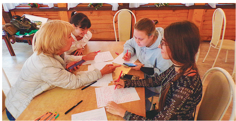
Разработка проектов по развитию нашего города – это интересно.