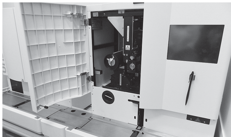
Мочевая станция позволяет делать биохимический анализ по 11-и параметрам.