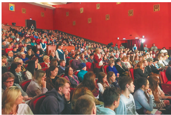
Вопросы к губернатору оказались разного плана — от личных, связанных с несправедливым увольнением, до набольших общественных, связанных с благоустройством дворовых территорий, состоянием теплосетей и удалённостью от города и отсутствием инфраструктуры участков для многодетных