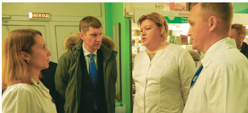
Большое внимание губернатор уделит сфере здравоохранения, посетит центральную городскую и детскую поликлиники, а также поликлинику в селе Фоки

После объединения с ЦГБ Фокинская участковая больница получила возможность зайти в проект «Новая поликлиника». Благодаря чему здесь был проведён необходимый ремонт, касающийся приведения в нормативное состояние зон ожидания, регистратуры, кабинета доврачебного приёма и дополнительного оснащения