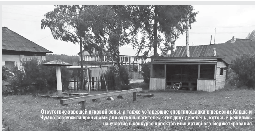
Отсутствие хорошей игровой зоны, а также устаревшие спортплощадки в деревнях Карша и Чумна послужили причинами для активных жителей этих двух деревень, которые решились на участие в конкурсе проектов инициативного бюджетирования.

— уличная спортивная площадка для гимнастических упражнений — 1 млн 250 тыс.