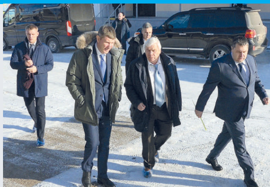
Максим Геннадьевич Решетников и генеральный директор ГК «Эрис» Владимир Иванович Юрков - на производственной площадке предприятия

Кроме объектов социальной инфраструктуры губернатор посетил крупнейшее градообразующее предприятие ГК «Чайковский текстиль», на котором с 2013 года идёт обширная модернизация, и современное активно развивающееся предприятие ГК «ЭРИС».