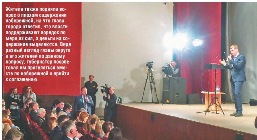
Жители также подняли вопрос о плохом содержании набережной, на что глава города ответил, что власти поддерживают порядок по мере их сил, а деньги на содержание выделяются. Видя разный взгляд главы округа и его жителей по данному вопросу, губернатор посоветовал им прогуляться вместе по набережной и прийти к соглашению.