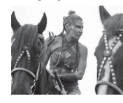
14.50 X/ф «САРЬ СКОРПИОНОВ-3: КНИГА МЕРТВЫХ» [16+]