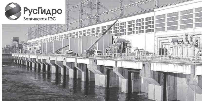
До 2023 года на Воткинской ГЭС будут заменены все выработавшие нормативный срок силовые трансформаторы и автотрансформаторы на новые большей мощности