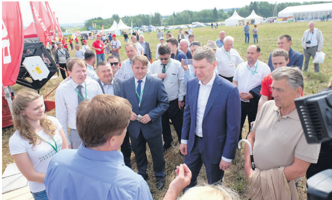
На «Агрофесте» сельхозпроизводители могут напрямую задать свои вопросы краевой власти

Выставка-форум объединила на своей площадке два крупнейших мероприятия: «Агропромышленная выставка «Агроурал» — выставка сельскохозяйственной техники, технологий, товаров и услуг для сельского хозяйства, на которой было представлено более двухсот новых образцов сельскохозяйственной техники, и «Прикамский День поля» — демонстрация техники и технологий в реальных полевых условиях.