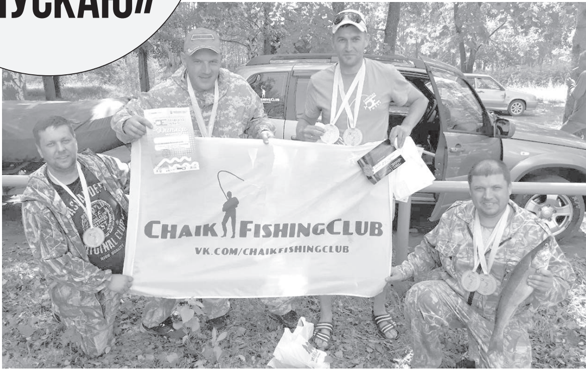
Команда «ChaikFishingClub» из Чайковского в этом году поймала самую большую «Еловскую рыбку»!

о запрете свободной продажи сетей в торговых точках, чтобы их могли покупать только промысловые бригады артельщиков. Тогда браконьеры, не думающие о сохранности популяции рыбных запасов, а ведущие лов исключительно ради наживы, будут иметь меньше возможностей для этого. Также чтобы пресекать браконьерскую ловлю, нужна мобильная и оснащённая всеми средствами рыбохрана, которой у нас, к сожалению, на сегодняшний день нет. Из-за недостатка финансирования на весь Чайковский район работает только два инспектора рыбохраны, которые физически не успевают отследить порядок на водных объектах нашего района. Если бы горе-рыбаки с сетями прислушались к запретам и боялись штрафов (к примеру, весенний запрет ловли рыбы во время нереста, когда рыбе надо дать естественным образом размножиться), тогда баланс в природе не был бы нарушен.