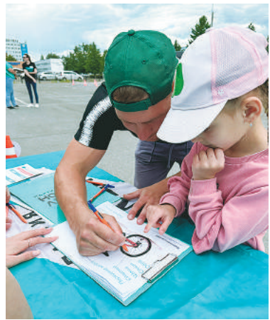
Интеллектуальные задания – тоже часть квеста. Выполнять их вдвоём интереснее.