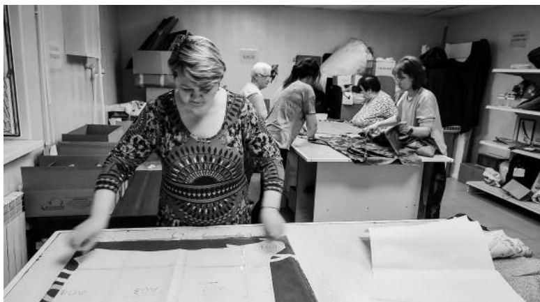
Наши мастерицы шьют и кроят практически ежедневно, хотя многие из них – многодетные мамы, у кого-то на руках инвалиды, требующие ухода. Женщины смогли распределить своё время и помочь армии.

сплетённой в браслет, – очень полезная на войне вещь, способная спасти жизнь. Браслеты стали для ребят на фронте настоящей находкой и даже талисманом – они сплетены с любовью и молитвами.