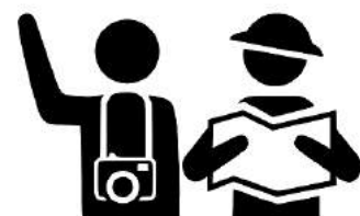
Материалы полосы подготовила Лидия Ломакина.

Туристам придётся заплатить 100 рублей с человека. Платным станет посещение природного парка «Пермский», а также Полодова и Колчимского камней. В министерстве природных ресурсов пояснили, что полученные средства будут направлены на благоустройство объектов и усиление охраны. В ведомстве добавили, что на этих территориях планируется установить 500 информационных знаков и аншлагов, более 100 лавочек, обустроить 25 турстоянок с навесами и местами для разведения костров.