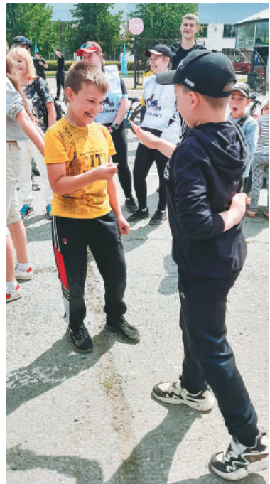
Скучать на празднике никому не пришлось.

подарков. Организаторы отметили всех участников, и ещё раз убедились, что традицию проведения в нашем городе велоквестов надо обязательно продолжать.