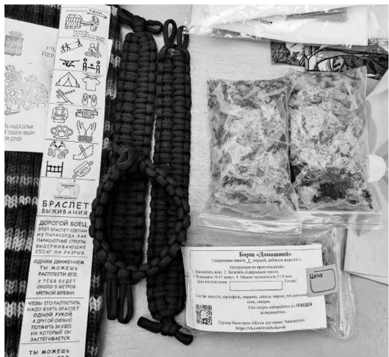
На аллее Славы 9 мая команда «Шьём для наших» представила чайковцам весь ассортимент своей продукции. К швейным изделиям добавились браслеты выживания, сухая овощная смесь для борща, смесь для сухого душа, вязаные носки и чулки для госпиталя.

Вера Мухаметдинова Фото автора и предоставлено группой «Шьём для наших»