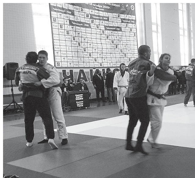
В чемпионате ПФО по дзюдо приняли участие мужские и женские команды.