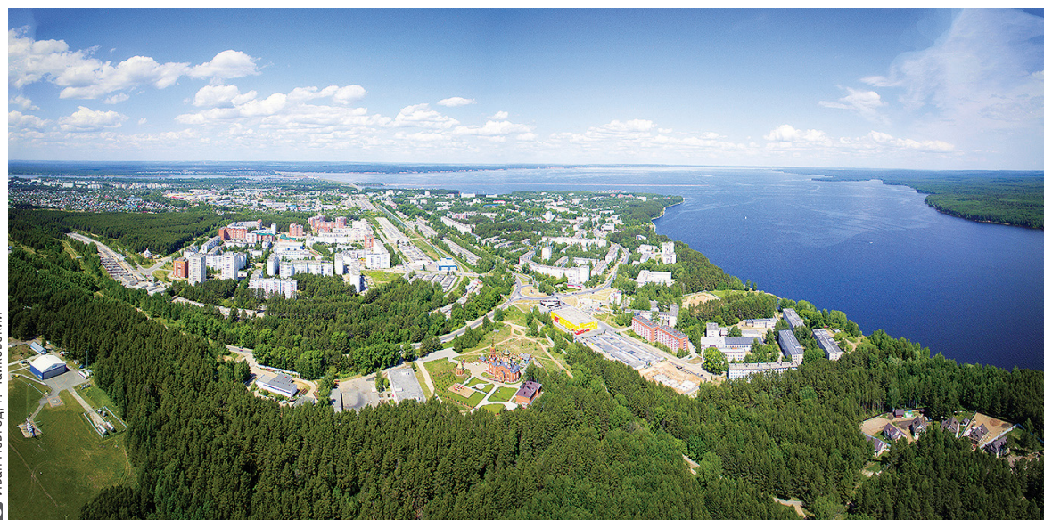
Чайковский всегда прекрасен, особенно в работах местных авторов.

Чайковский историко-художественный музей просторно разместил фотовыставку на площади 150 кв. м