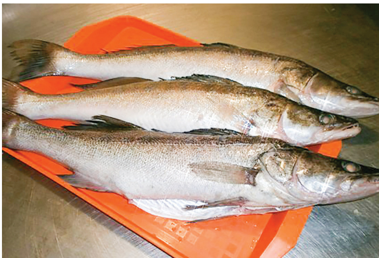
Качеству продукции в чайковском «Рыбхозе» уделяется самое пристальное внимание.

– Живу в Ижевске. В вашем городе бываю часто по работе. Как-то посоветовали заехать в «Рыбхоз». И вот – каждую командировку я здесь, ещё и с заказами сюда в магазин приезжаю, леща горячего копчения здесь покупаю, судачка свежего, стерлядь иногда. В общем, выхожу из магазина всегда с полными пакетами.