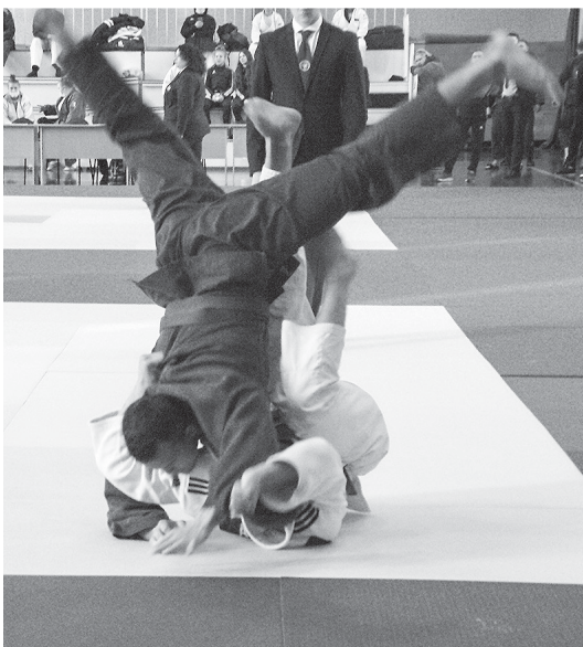
Участники турнира продемонстрировали виртуозную технику дзюдо и волю к победе.