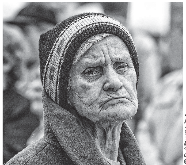
Уличный портрет – популярный жанр у публики во все времена.