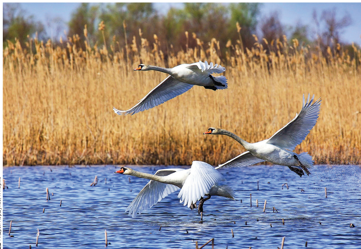
Анималистика – один из самых сложных жанров фотоискусства.