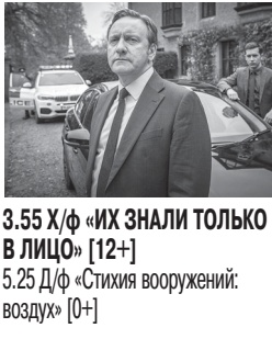
3.55 Х/ф «ИХ ЗНАЛИ ТОЛЬКО В ЛИЦО» [12+]

Это яркое часовое состязание между двумя звездными семьями. Неважно, взрослый вы или ребенок, каждый сможет погрузиться в эту забавную эстафету.