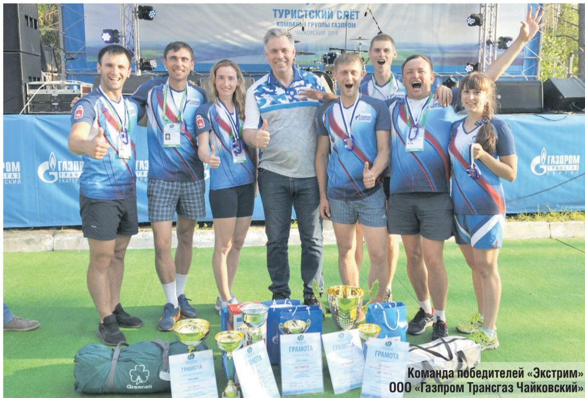
Команда победителей «Экстрим» ООО «Газпром Трансгаз Чайковский»

ЧАЙКОВСКИЙ ПРИНЯЛ ПЕРВЫЙ ТУРИСТСКИЙ СЛЁТ КОМПАНИЙ ГРУППЫ ГАЗПРОМ