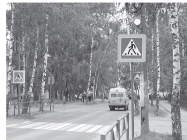
Пешеходный переход к СОШ № 10

В ПЕРМСКОМ КРАЕ ВЕДЕТСЯ АКТИВНАЯ РАБОТА ПО ПОДГОТОВКЕ ШКОЛ НОВОМУ УЧЕБНОМУ ГОДУ, ПРОВОДЯТСЯ МЕРОПРИЯТИЯ ПО ОБЕСПЕЧЕНИЮ БЕЗОПАСНОСТИ ПРИШКОЛЬНЫХ ТЕРРИТОРИЙ.