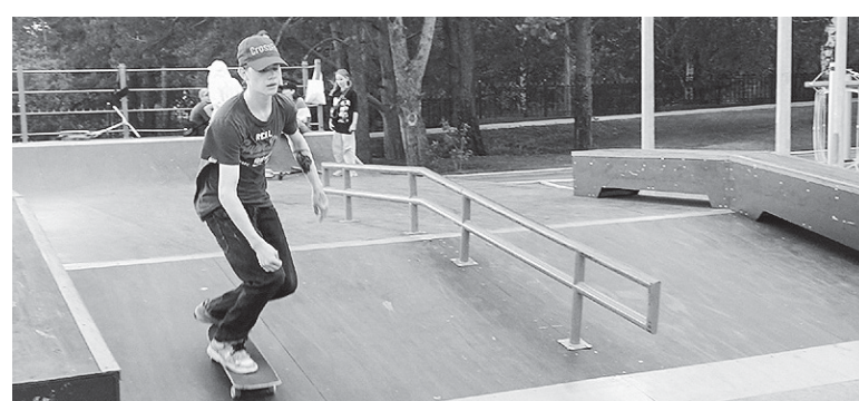
Материалы страницы подготовила Ирина Ломкина.

Спортивная площадка, оборудованная за санаторием «Чайка», включает в себя также игровые зоны для самых маленьких, тренажёрную площадку, зоны для игры в баскетбол и пляжный волейбол. Правда, в местных городских соцсетях начали появляться сообщения о том, что баскетбольная и волейбольная площадка закрыты для общего доступа, что жителей крайне