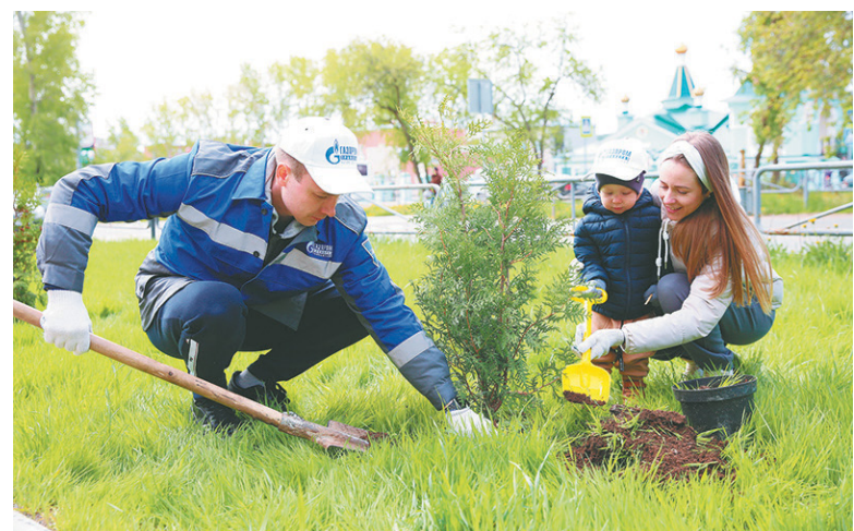
Во время акции «Зелёный город» семьи газовиков посадили 36 саженцев туи.

Дмитрий Акулов, Наталья Сагитова