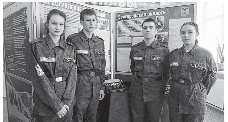
В наш город передвижная выставка приехала по инициативе чайковского поискового отряда «Звезда», созданного на базе Станции детского и юношеского туризма.