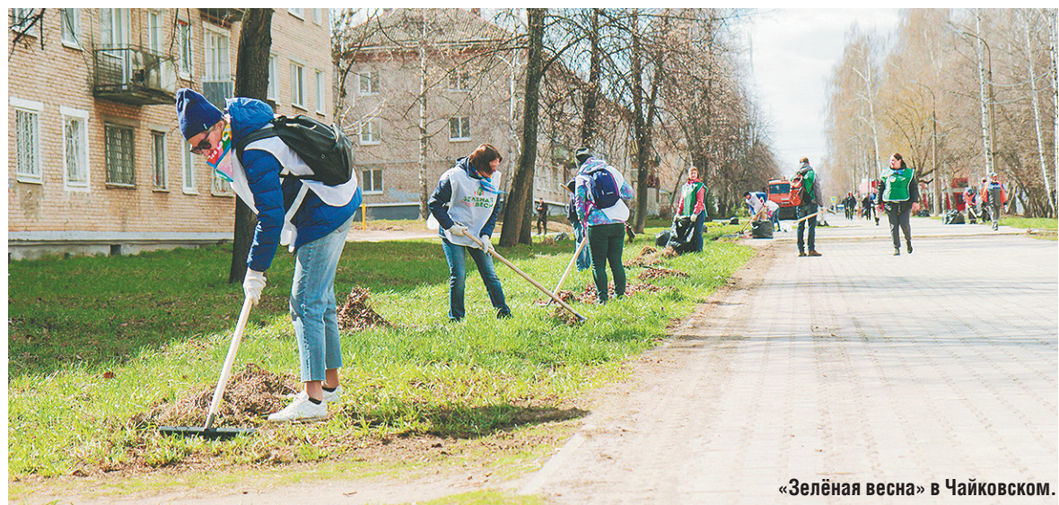
«Зелёная весна» в Чайковском.