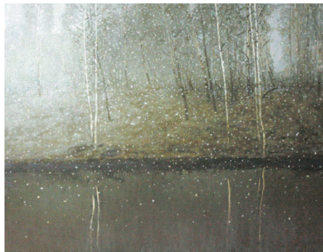
«Снова снег», холст, масло, 2018 год