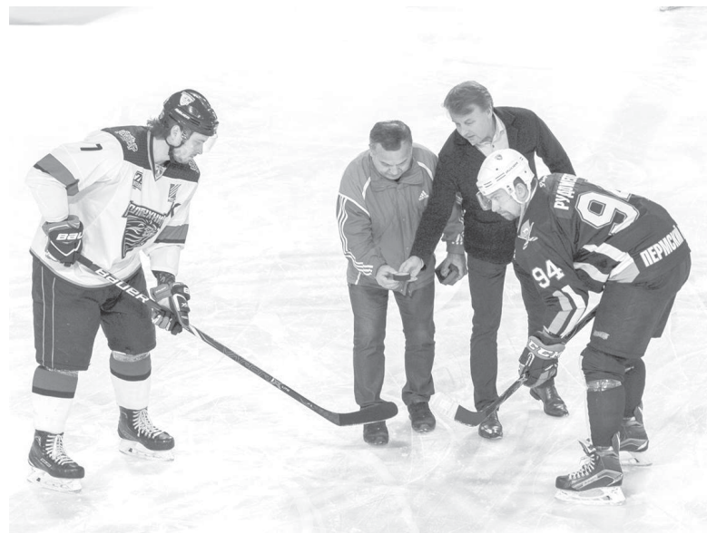
Символическое вбрасывание шайбы прошло с участием почетного гостя